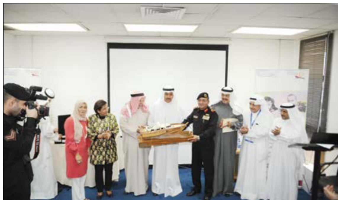
إهداء نموذج لقارب رحلة الأمل