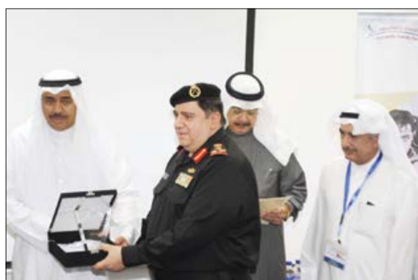
درع تذكارية لأحد الضباط

وأهدى الحجوي نموذجا لقارب رحلة الأمل لأمر القوة البحرية العميد الركن بحري جاسم الأنصاري، ونموذجا آخر للعميد الركن بحري خالد الكندري مدير العمليات البحرية، إضافة إلى دروع تذكارية لجميع الضباط الذين ساهموا في هذا الإنجاز، وذلك تقديرا من مجلس الأمناء والإدارة التنفيذية للرحلة لهذه الجهود المخلصة، بدوره، تقدم أمر القوة البحرية العميد الركن بحري جاسم الأنصاري بالشكر لمجلس الأمناء والإدارة التنفيذية على هذه المبادرة الطيبة، وإلى القائمين على هذا المشروع الإنساني والساعي إلى دعم إيماننا من ذوي الإعاقة الذهنية ومجهد في المجتمع كعناصر فاعلة، ونشر تجارب الكويت الرائدة في مجال رعاية أبنائها بصورة حضارية تليق بصورتها عالميا. وأعرب الأنصاري عن استعداد القوة البحرية لتقديم كل أنواع الدعم مستقبلا للرحلة إلى حين عودة القارب إلى أرض الوطن وذلك تنفيذًا لتوجيهات نائب رئيس مجلس الوزراء ووزير الدفاع الشيخ خالد الجراح بتذليل جميع الصعوبات وتقديم الدعم الدائم لهذه المبادرة الإنسانية التي حظيت برعاية سامية من صاحب السمو الأمير القائد الأعلى للقوات المسلحة الشيخ صباح الأحمد.