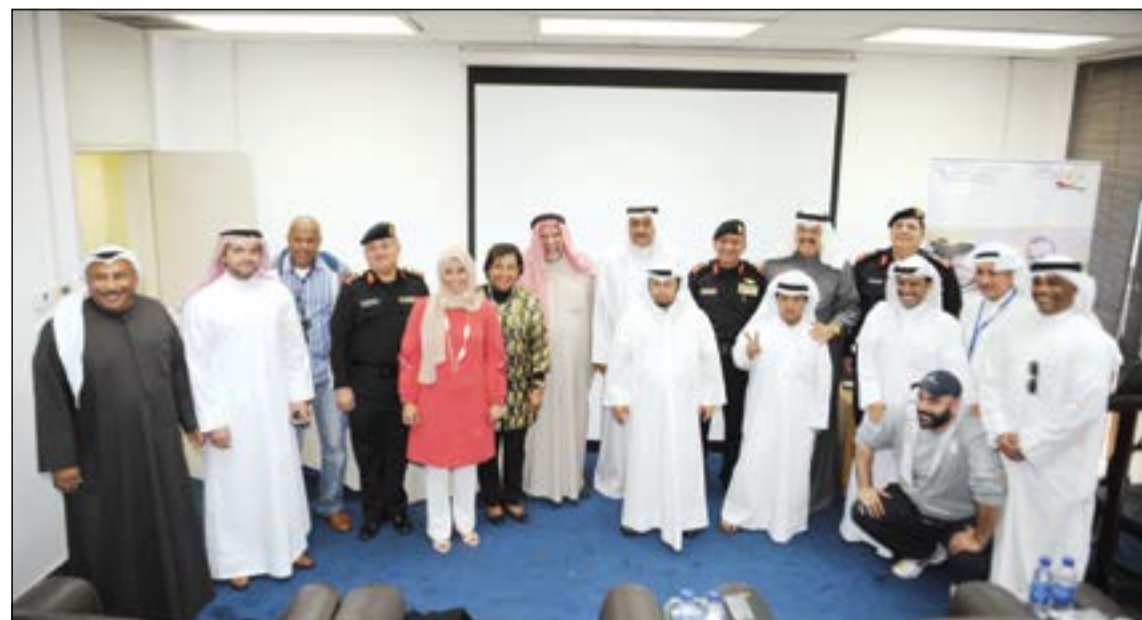
وفد مجلس أمناء رحلة الأمل وإدارتها التنفيذية في قاعدة محمد الأحمد البحرية