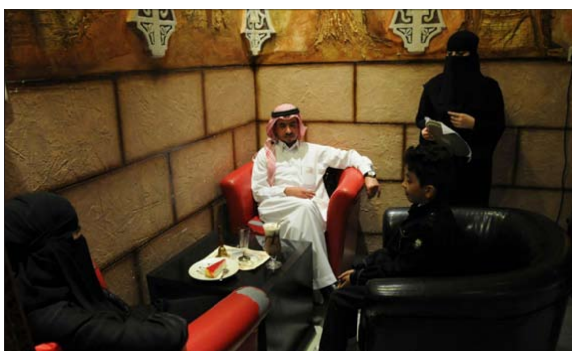
سعودية تقدم قائمة الطعام لزيارتين في احد الكافيهات في منطقة تبوك السعودية. وقد اقتضت المرأة سوق العمل في قطاعات جديدة واختصاصات غير المألوفة للكليجين

العربية أن تبذل جهداً أكبر لإدماج النساء في الاقتصاد وتسهيل وصولهن إلى التمويلات وبرامج الدعم. وأضافت «شهد وضع ملحوظ مع انطلاق الربيع العربي في عدد من بلدان شمال أفريقيا، لكن أظن اليوم أن هناك توازناً وفرصاً أكبر لمشاركة النساء بشكل فاعل في تطوير اقتصاديات المنطقة».