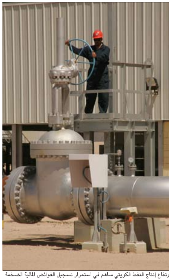
ارتفاع إنتاج النفط الكويتي ساهم في استمرار تسجيل الفوائض المالية الضخمة

ان الكويت استمرت في سياسيتها النقدية الموائمة وتزايد معدل نمو الائتمان إضافة إلى استقرار ربحية البنوك خلال العام الحالي، مؤكداً في الوقت نفسه قوة مؤشرات السلامة المالية حيث يبلغ متوسط معدل كفاية رأس المال للبنوك نحو 18,3% (16,6% للمستوى الأول لرأس المال) كما في نهاية يونيو الماضي. وذكر التقرير أن إجمالي الديون غير المدفوعة لدى البنوك الكويتية تراجع إلى نحو 4,6% في يونيو الماضي من 5,2% في نهاية عام 2012 في وقت بلغت نسبة تغطية المخصصات لدى البنوك نحو 107% في نهاية يونيو الماضي. وقال التقرير إن بعض شركات الاستثمار واصلت تسجيل خسائر في عام 2012 وإن كان بمعدلات أدنى مقارنة بعام 2008 ولا تزال بعض تلك الشركات تعمل على تقليص مديونياتها وإعادة هيكلة أوضاعها المالية. وعن آفاق الأداء الاقتصادي الكويتي توقع صندوق النقد