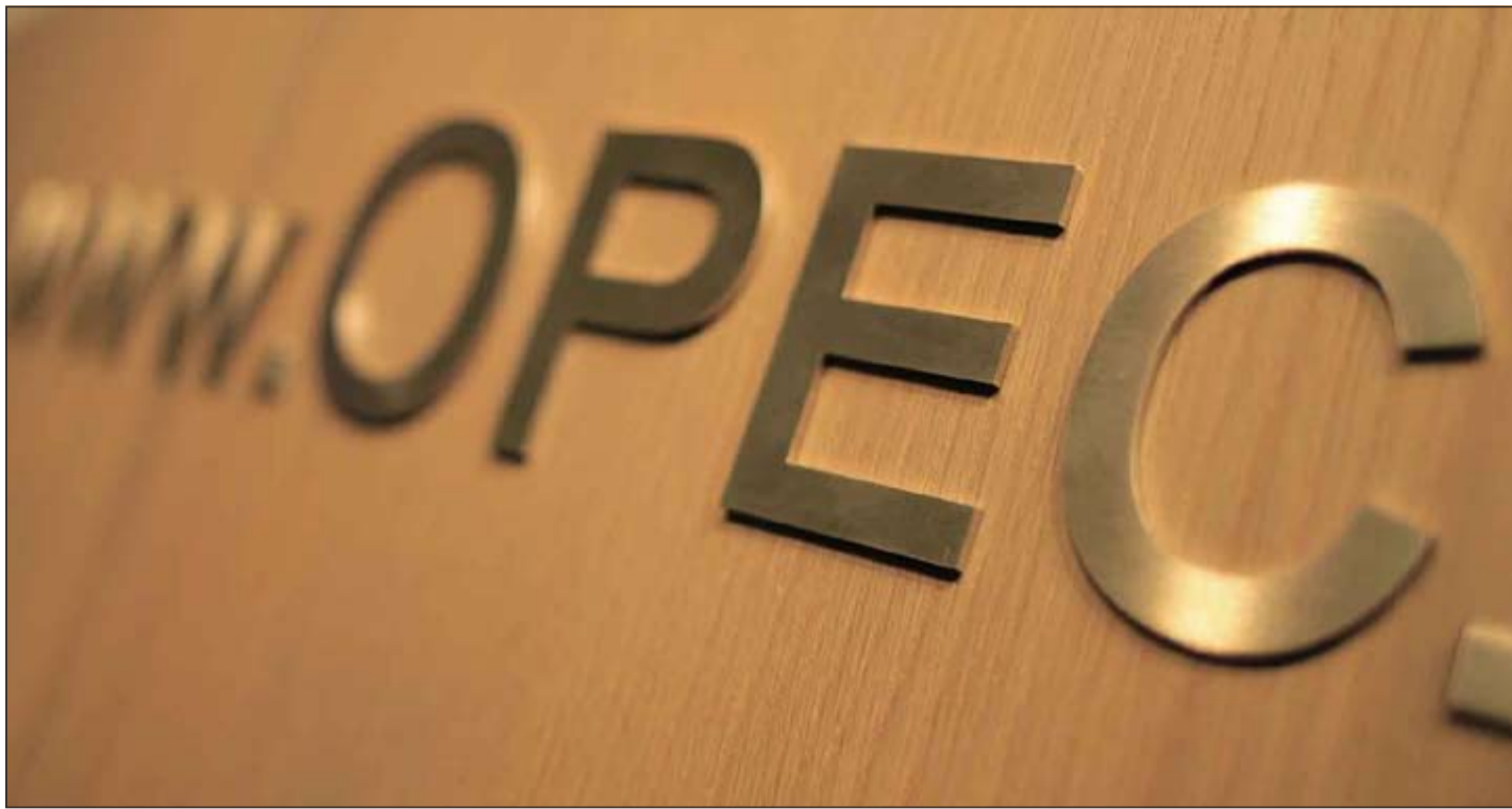
شعار أوبك في اجتماع فيينا امس (رويترز)