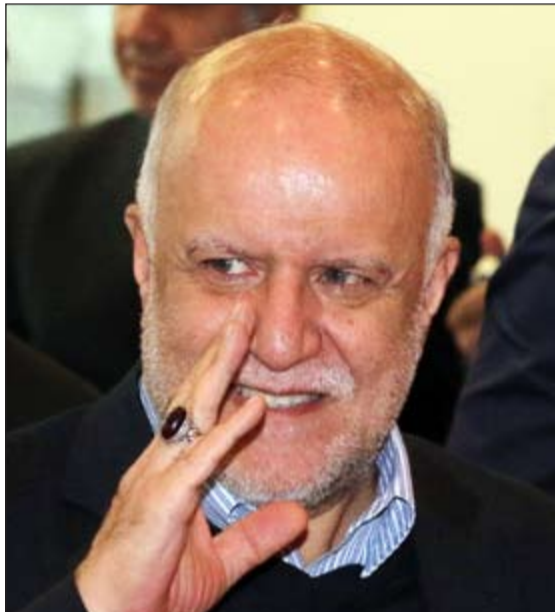
وزير النفط الإيراني بيجن زنكنة.. وتحية من اجتماع أوبك

النفط يواصل الهبوط رويترز: انخفض مزيج برنت الخام أكثر من دولار إلى 111,54 دولار للبرميل أمس مواصلاً خسائره في أعقاب اتفاق منظمة أوبك على تمديد العمل بسقف الإنتاج عند 30 مليون دولار يوميا لمدة ستة أشهر أخرى حتى الاجتماع المقبل في يونيو 2014.