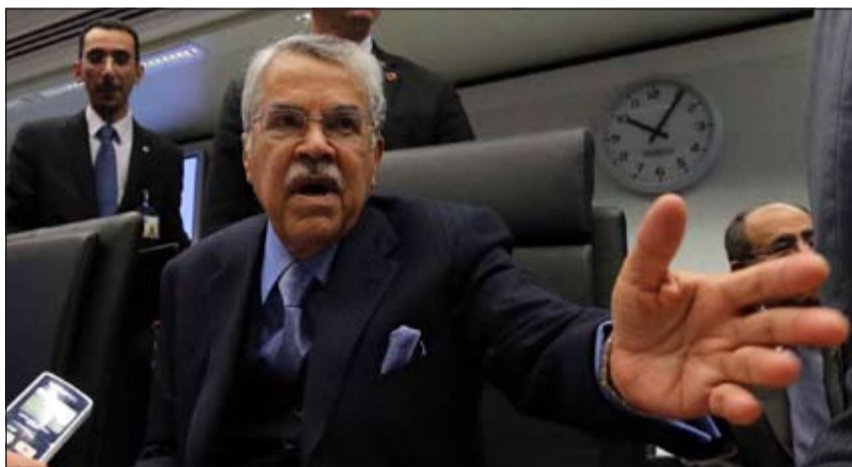
وزير النفط السعودي علي النعيمي في إحدى مداخلته في اجتماع «أوبك» امس (رويترز)

فيينا - وكالات: قررت امس منظمة الدول المصدرة للنفط «أوبك» الإبقاء على سقف إنتاجها المحدد بثلاثين مليون برميل يوميا خلال اجتماعها امس، كما تم تمديد ولاية أمينها العام عبد الله البدري لمدة ستة واحدة. وتستفيد «أوبك» التي تضم في عضويتها 12 دولة من أسعار النفط الحالية التي تبلغ 112 دولارا للبرميل خام برنت إذ انها تزيد كثيرا على السعر المفضل 100 دولار، وتضخ ليبيا وإيران وهما من الدول الأعضاء كميات أقل بكثير من الطاقة الإنتاجية بسبب اضطرابات في الأولى وعقوبات في الثانية وهو ما يدعم أسعار الخام.