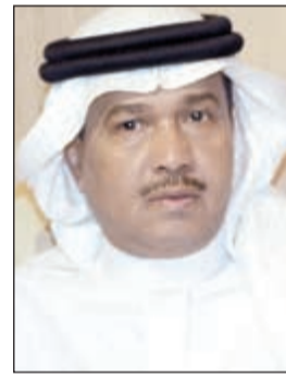
فنان العرب محمد عبده