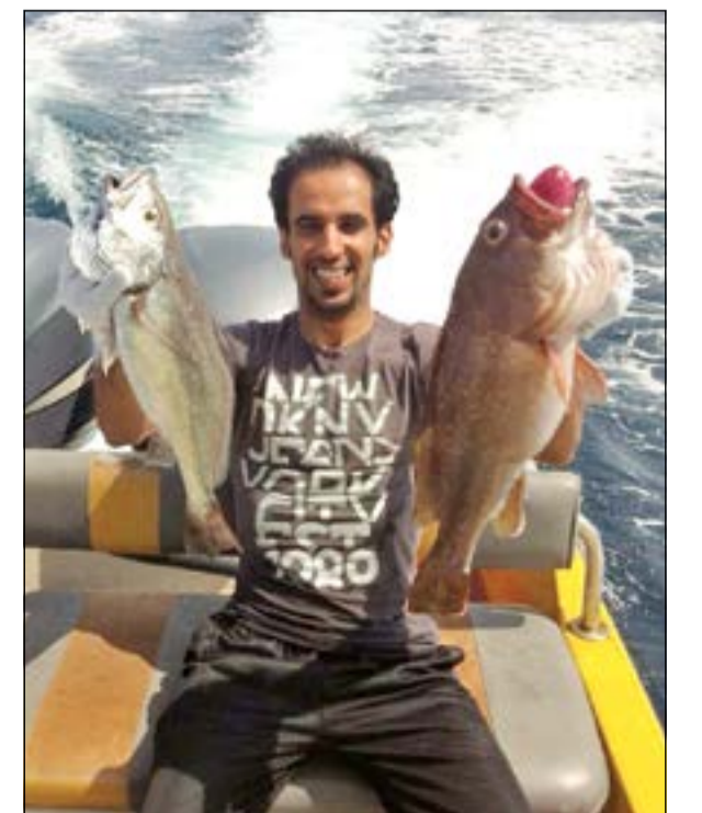
يا سلام عليك يا ولد