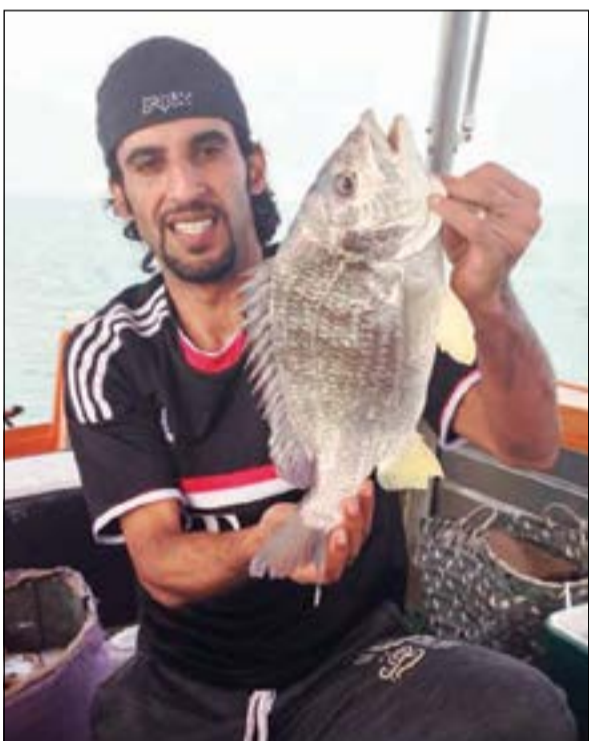
هذا الشعم العجيب

● كلمتي الأخيرة أوجهها الى اصحاب القراقرير والمشارك وأقول لهم كفوا اذاكم عن بخرنا وعنا وأقول ايضا لمن يقوم برمي البراميل الفارغة والاطارات ليعمل لنفسه قوعة خاصة ان هذا الذي يرتكبه شيء خطير للغاية لما فيه من دمار للبيئة البحرية وايضا أقول لآخواني الحداقة اهتموا بعدة السلامة والإسعافات الأولية كاملة فهي ضرورية جدا ويجب التشديد على الطراد دائما والفحص الدوري للماكينة والقيام بشيء أساسي وانصحهم بعدم الخروج للصيد اثناء موسم السرايات والبوارح وفي النهاية أقول لكل حداق لا تكبر رأسك على البحر أبدا والفهم يفهم.