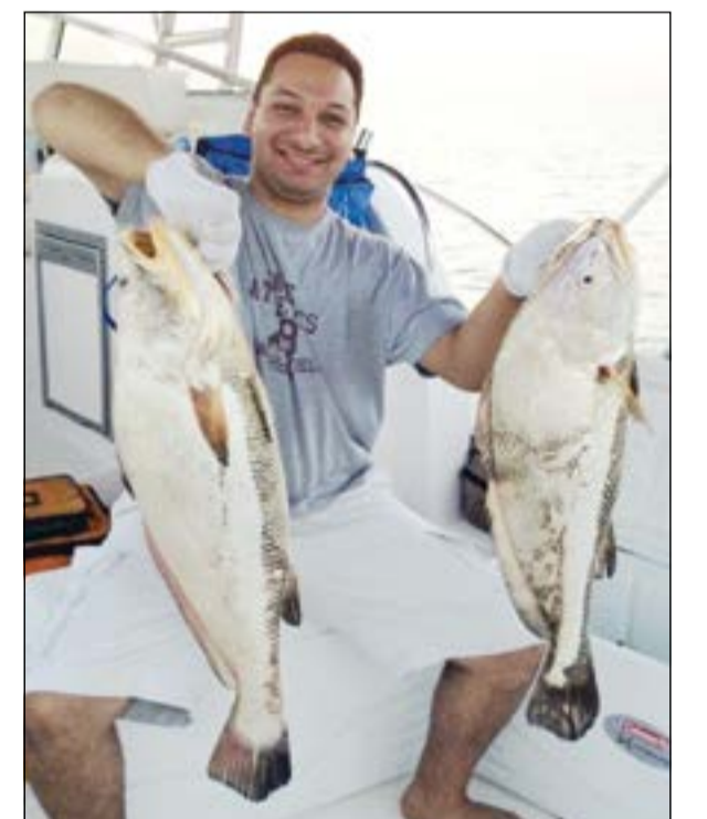
أحلى صيده.. فروخ شمائية