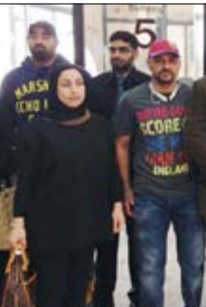
عدد من الصيادلة المشاركين في الاعتصام أمام وزارة الشؤون

في الجمعية، منوها إلى أنه على مدار 3 سنوات يفترض سحب 60 دينارا اشتراكا إلا أنني سحب مني 250 دينارا على مدى 3 سنوات، وعلى الرغم من ذلك اسمي غير مذكور في كشوف الانتخابات، متسائلا: ما السبب؟! وأضاف: مللنا من المجيء إلى وزارة الشؤون، وكل أسبوع الوزارة تقول لنا الأسبوع القادم، فإلى متى يظل الوضع على ما هو عليه، نحن نشعر بغصّة لضباغ ونحن لا نطالب إلا بحقوقنا، وتطبيق القانون.