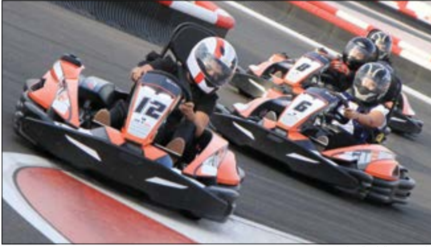
جانب من فعاليات السباق