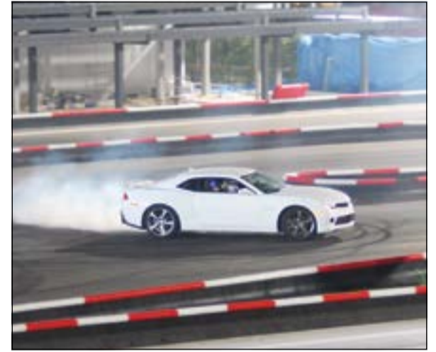
الثبات في المنحدرات