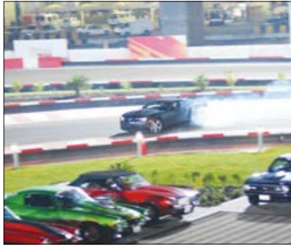
قوة كبيرة لسيارة كامارو الرياضية