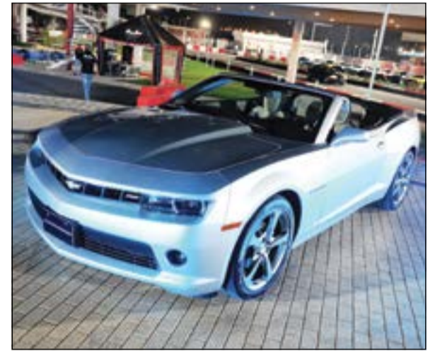
كامارو تخطف الأنظار دائماً

ومناطق الصدر والركب. كما يحافظ قفص المقصورة المصنوع من الفولاذ عالي الصلابة على السلامة وحماية جميع ركاب السيارة. تتعهد شركة يوسف أحمد الغانم وأولاده للسيارات وشرفوليه بتقديم تجربة تسوق وشراء وتملك متميزة من خلال مجموعة من المنتجات والخدمات والمنشآت الاستثنائية التي تداعب مشاعر العملاء وتلبي متطلباتهم ويوضع العميل في صميم كل ما يقومون به من خلال «تعهد شرفوليه» الوعد الذي قطعته شرفوليه على نفسها لتقديم عملائها تكاليف الخدمة والمزيد من الشفافية وخدمات سريعة وموثوقة ضمن مستويات هي الأفضل في قطاع صناعة السيارات، هذا بالإضافة إلى تجربة خدمة عملاء لا يمكن مقارنتها. ومع هذه المزايا يمكن ويمكن لعشاق كامارو ومحبي الإنارة والتشويق الحضور إلى معارض شركة يوسف أحمد الغانم وأولاده لتجربة قيادة كامارو الجديدة.