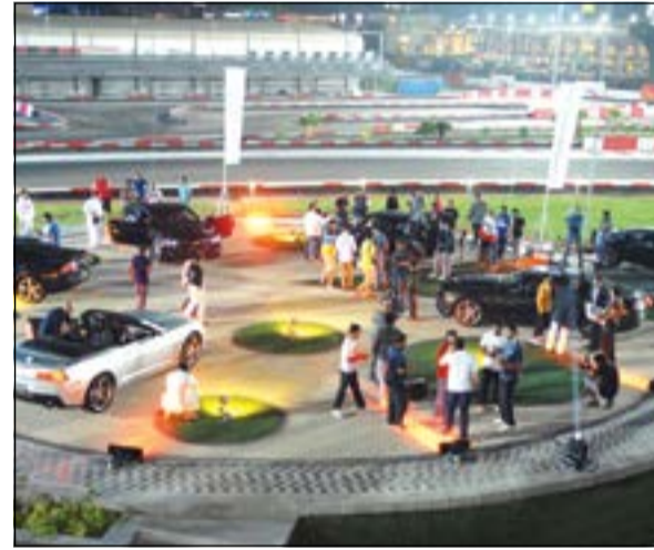
حضور كبير في احتفالية الغانم بكامارو 2014