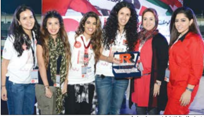
عضوات اللجنة المنظمة في صورة جماعية

Rush الآن في سباق Drag والكارتينج. وتستمر «الوطنية للاتصالات» بدعم الشباب في الكويت في جميع الفئات بما في ذلك الرياضة، والتعليم والترفيه والتكنولوجيا.