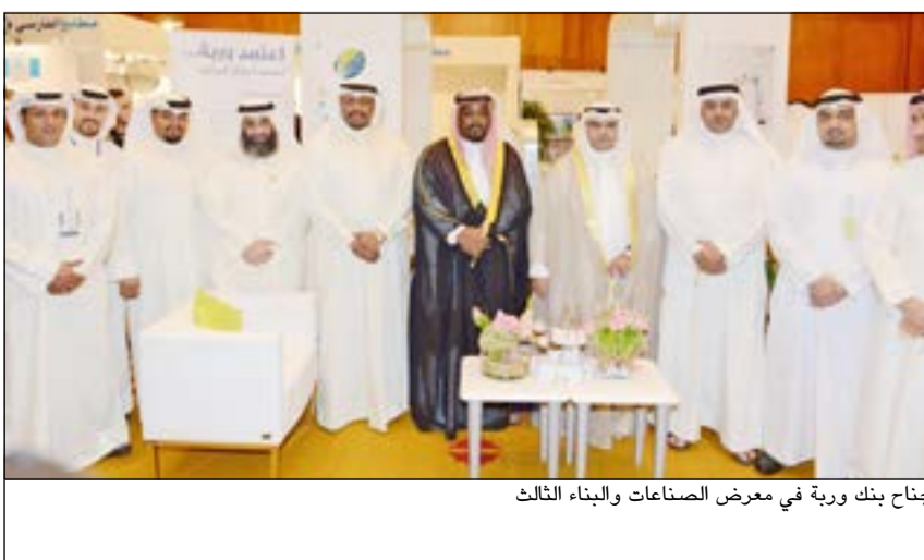
جناح بنك وربة في معرض الصناعات والبناء الثالث

ولفت التقرير إلى بداية السبعينيات، حيث كانت وزارة الإعلام ممثلة بالقطاع السياحي الذي كان يترأسه في ذلك الوقت صالح شهاب رحمه الله، تقوم بإعداد برامج ترفيهية وحفلات وأنشطة متعددة للمواطنين والمقيمين في فترة الصيف، وكانت تلك هي باكورة التفكير في السياحة الداخلية في البلاد، وقد استضافت الكويت في تلك الحقبة الكثير من الفرق العالمية والفنانين وكان للمسرح الكويتي صدى متميز على مستوى دول المنطقة، ثم تلته بعد ذلك فكرة تأسيس شركة المشروعات السياحية والتي تضم الآن أكثر من 17 مرفقا موزعا على خريطة الكويت، وكانت تلك المرافق بمنزلة نقلة نوعية في المجال السياحي والترفيهي في البلاد وفي الوقت نفسه كانت بمنزلة