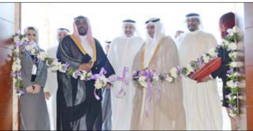
قص شريط افتتاح المعرض

مجموعة من الرعاة البلاطين، وهم: شركة علي الغانم للأرضيات والأدوات الصحية، وشركة علي الغانم للمطابخ وتجهيزاتها، والشركة المتحدة لصناعة الحديد كويت ستيل، وشركة الصناعات الوطنية، وبيت التمويل الكويتي، وبتك وربة، وشركة منار العمران (منار السعودية).