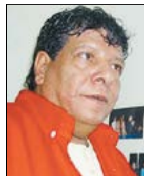
شعبان عبد الرحيم

وأقيم العزاء أمام منزل شعبان بمنطقة فيصل، وحرص عدد من زملائه على تقديم واجب العزاء له، منهم الشاعر إسلام خليل وعدد من المطربين الشعبيين الذين يرتبط معهم بعلاقة صداقة قوية.