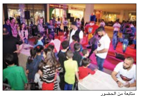
متابعة من الحضور