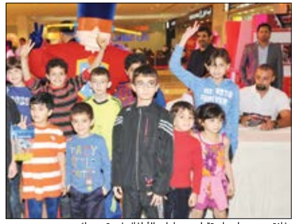
فانتسي وورلد، استقطبت مهارات الأطفال في تحد رائع