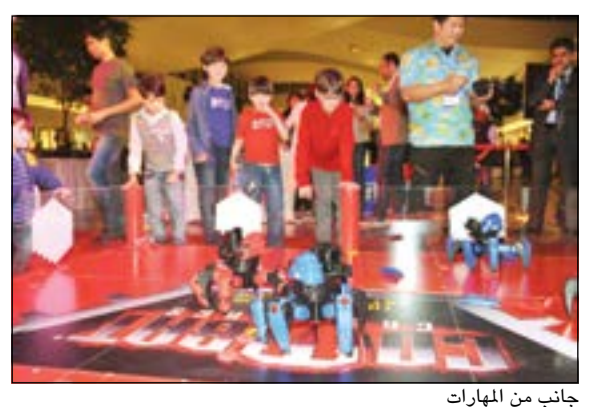
جانب من المهارات