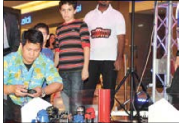
جانب من العرض