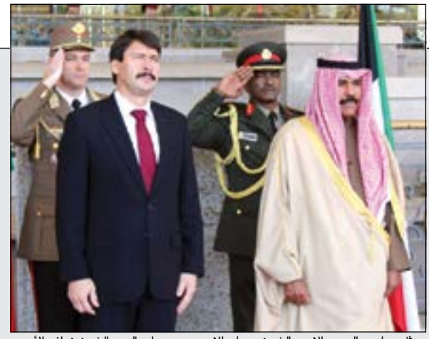
ممثل صاحب السمو الأمير الشيخ صباح الاحمد سمو ولي العهد الشيخ نواف الاحمد خلال لقائه هنغاريا

ممثل الأمير بحث مع رئيس هنغاريا القضايا المشتركة والمستجدات الإقليمية والدولية 07