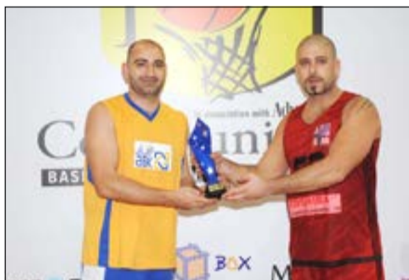
تسليم الجوائز والهدايا التذكارية