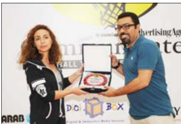
تبادل الدروع في الختام

وفي نهاية البطولة قامت مديرية تحرير مجلة «communicate» بدعوى بتسليم الفرق الفائزة بالمراكز الأولى كأس وجوائز البطولة. البطولة التي أقيمت على مدى 3 أيام في صالة جامعة الخليج، شهدت تقديم مستويات عالية من الفرق الـ 8 التي شاركت فيها، هذا بالإضافة إلى الإقبال