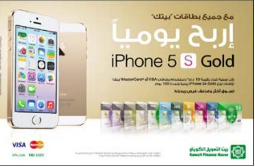
الجائزة مع بطاقات بيتك

السحب الذي يقدم فرصة ربح جائزة يومية قيمة عبارة عن جهاز «آيفون S5» مقابل كل 10 دقائق للشراء فقط داخل وخارج الكويت، وكذلك من خلال استخدام بطاقات الصرف الآلي خارج الكويت، والدخول في السحب، وكلما تضاعف مبلغ الإنفاق زادت فرص التاهل لدخول السحب الإلكتروني الذي يجري أسبوعيا.