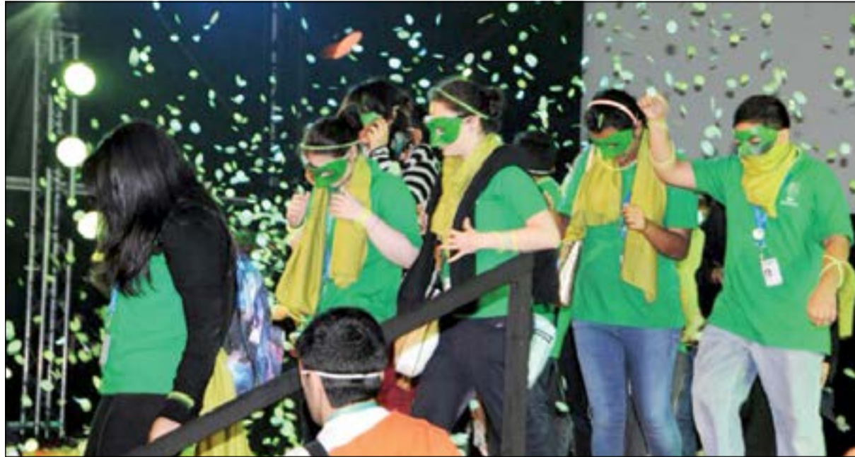
لجنة تحكيم المهرجان من الاطفال بعد اعلان النتائج