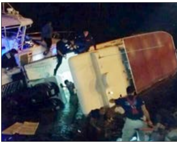
تصادم الزورقين وقع مقابل مرسي شرق