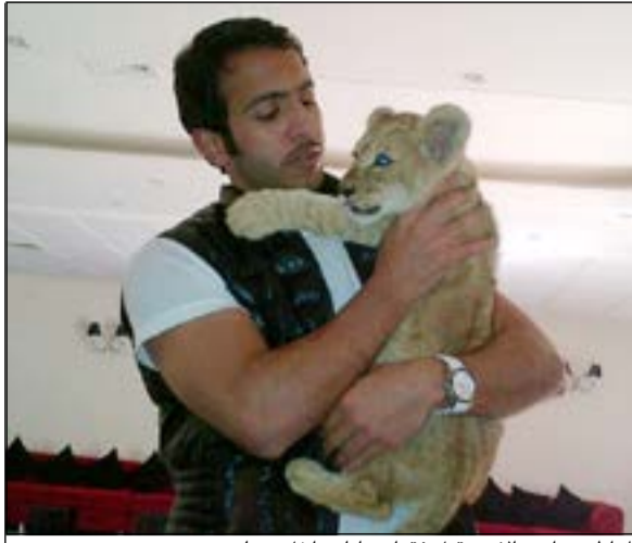
المواطن يداعب الاسد قبل فقائه بايام داخل منزله

وقال المصدر ان مواطنا في العقد الثالث من العمر تقدم لمخفر الجهراء مساء امس الاول حيث افاد بانته فور خروجه من احد المستشفيات الخاصة شاهد حافلة تقوده قد اخذت بالإضافة الى سلاح ناري وسجلت قضية. من جانب آخر، تقدم مواطن الى مخفر الجهراء يفيد باختفاء مبلغ 500 دينار من داخل سيارته أثناء توقفها في ساحة نادي الجهراء الرياضي، وعليه سجلت قضية.