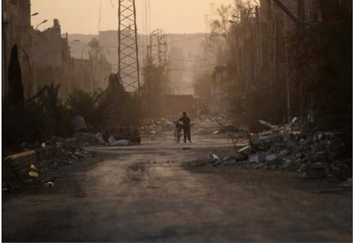
سوري يعبر أحد الشوارع المدمرة في دير الزور السورية

بروكسل - كونا - أ.ف.ب: كشفت منظمة حظر الأسلحة الكيميائية أمس عن عرض قدمته الولايات المتحدة للمساهمة في تدمير المواد الكيماوية السورية الأكثر خطورة بتوفير الدعم التشغيلي الكامل والتمويل وتكنولوجيا التدمير لتلك المواد المراد نقلها خارج البلاد بحلول الـ 31 من ديسمبر. وذكرت المنظمة في بيان صحافي أنه سيتم إجراء عمليات تحييد المواد الأكثر خطورة على سفينة أميركية في البحر باستخدام تقنية التحلل المائي، حيث تخضع سفينة تابعة للبحرية الأميركية لعدة تعديلات لدعم عمليات التحييد وقبول أعمال التحقق من قبل المنظمة.