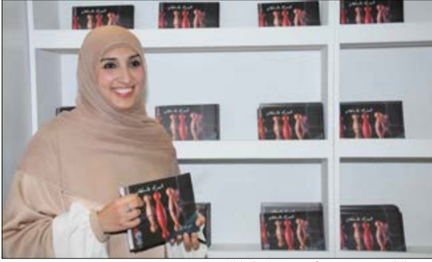
تسليم المذكور تستعرض نسخة من «شهرزاد والسلطان»