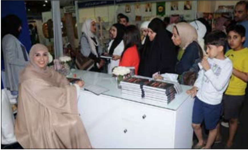
تهاجت من القراء للحصول على نسخة موقعة من المذكور