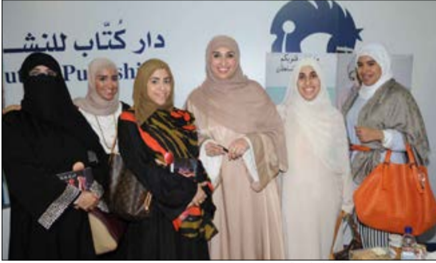
تسليم المذكور مع بعض القارئات لدى التوقيع