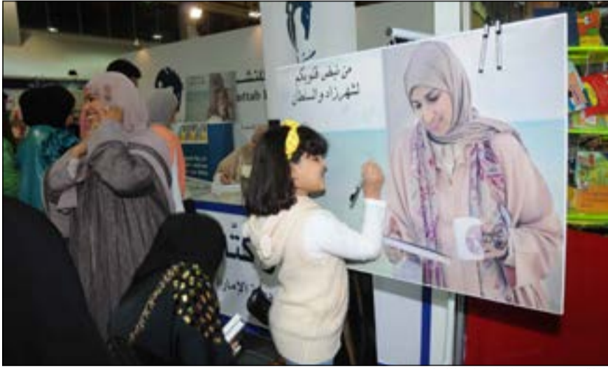
طفلة تترك توقيعها على بانر للكتاب

ربما تعقبنا على صورة سبق أن نشرتها على حسابها في انستغرام، مضيفا أنه من خلال نظريته السريعة للكتاب يشعر بأنه يحكي قصولا ومواقف مر هو شخصيا بها.