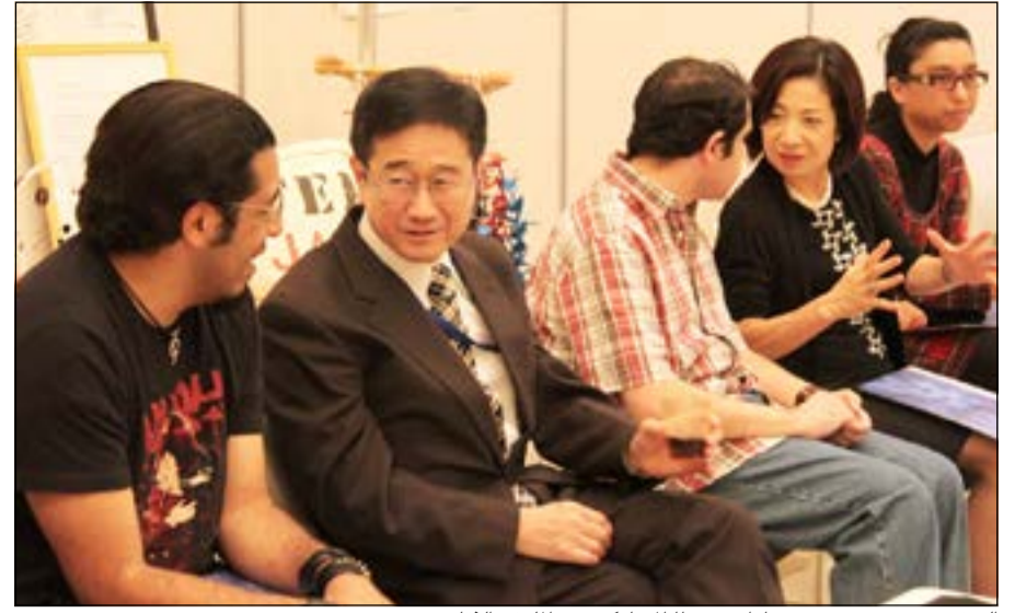
السفير توشيهيرو تسوجيهارا متوسلا المشاركين في الملتقى الثقافي

أقامتها سفارة اليابان بمشاركة مجموعة من المواطنين