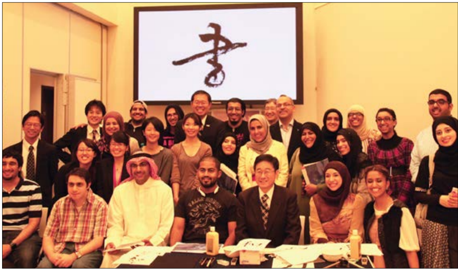
المشاركون في الملتقى مع أعضاء السفارة في «الديوانية اليابانية»

رئيس البعثة الديبلوماسية بالسفارة اليابانية: هناك تبادل ثقافي متميز بين الكويت واليابان