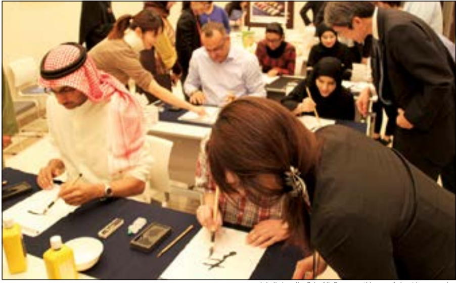
جانب من المشاركين خلال تجربة الكتابة بالخط الياباني «شودو»