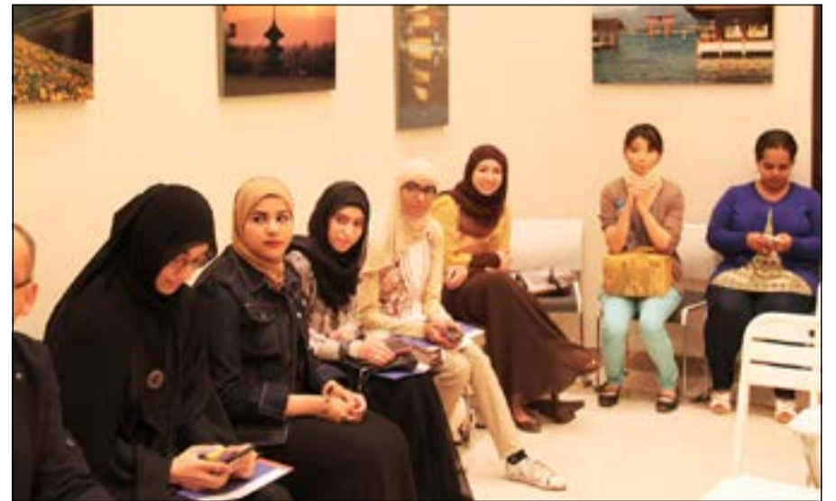
مجموعة من المشاركين