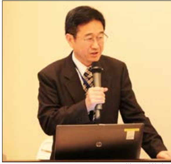
.. وملقيا كلمته في الملتقى