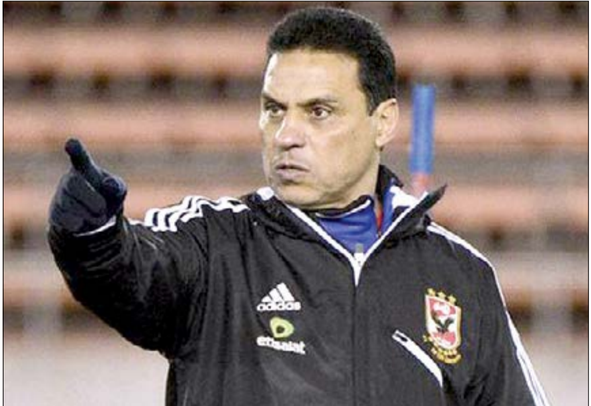
حسام البدري كان يتوقع أن يتم اختياره مدربا لمصر