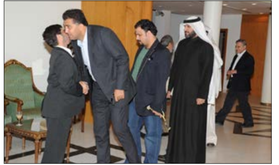
رئيس المستشارية الإيرانية عباس خامه يار يستقبل المعززين (قاسم باشا)