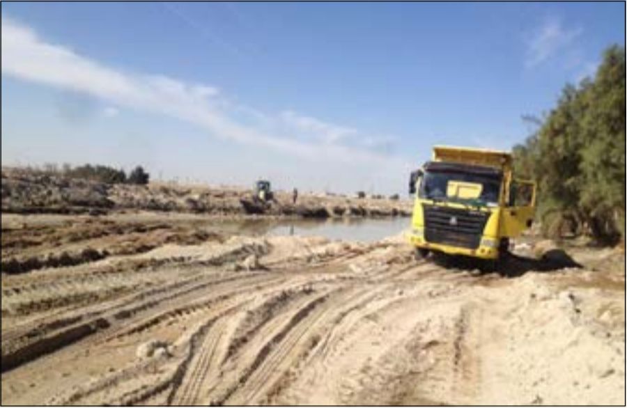
جانب من حملة ردم الساحات المنخفضة لمنع تجمع مياه الأمطار