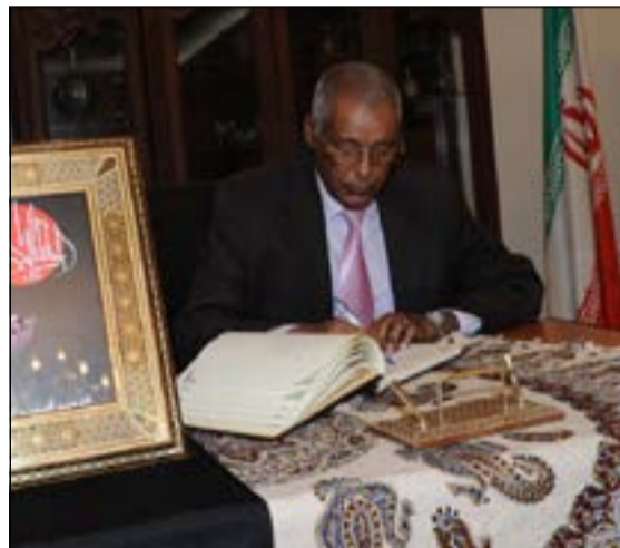
سفير إثيوبيا شارك بواجب العزاء