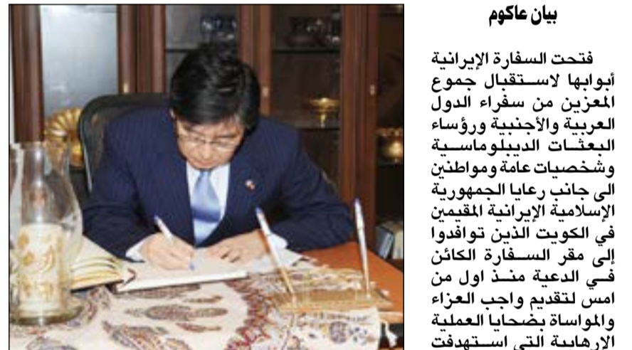
السفير الكوري كيم كونغ سيك يسجل تعازيه