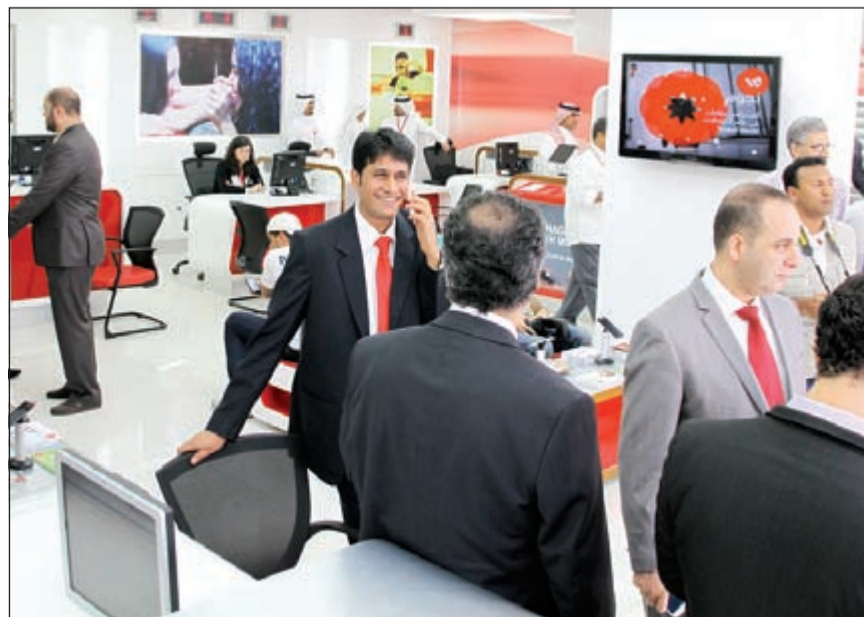
تزايد عدد عملاء الوطنية مع تنفيذ استراتيجية جديدة تركز على خدمة العميل أولاً

شهدت «الوطنية» مؤخرًا انتداب خبرات وكفاءات ما الهدف من هذا؟ ● «الوطنية»، هي جزء من مجموعة Ooredoo، ووجد برنامج قائم على تبادل الكفاءات، وهذا يهدف إلى تحسين النوعية والاستفادة من الخبرات، ونحن نستقطب الكفاءات العالية من قطاع الاتصالات لاستفيد بخبراتهم سواء من الكويت أو خارجها واعتبر أن التنوع والتغيير مطلوب باستمرار.