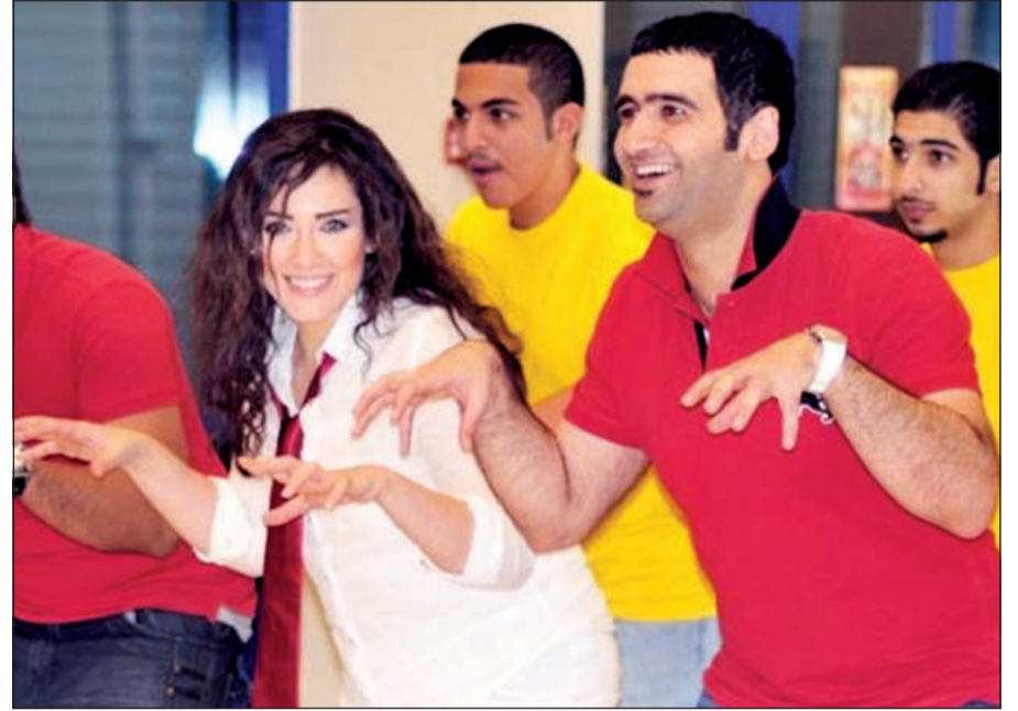
مسرحية «الاختراع العجيب»