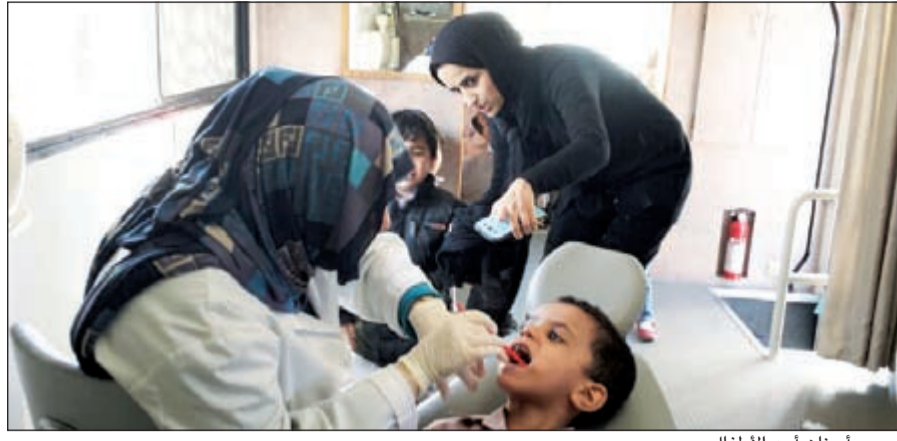
فحص أسنان أحد الأطفال