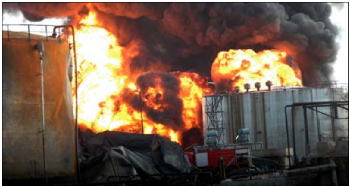
صورة وزعتها «سانا» لحريق شب في أحد خزانات مصفاة حمص بعد أن قصفها مسلحون معارضون قبل أيام (أ.ب)

عواصم - وكالات: أعرب وزير خارجية إيران محمد جواد ظريف عن استعداده بلاده للمشاركة في محادثات مؤتمر «جنيف 2» للسلام في سورية «إذا وجهت إليها الدعوة»، في وقت رحبت الجامعة العربية بتحديد موعد المؤتمر في 22 يناير المقبل. وقال ظريف لقناة برس تي.في «نرى أن مشاركة إيران في جنيف 2 - إسهام مهم في حل المشكلة. قلنا دائماً إنه إذا دعيت إيران فسنشارك دون أي شروط مسبقة». يأتي ذلك وسط جدل لم يحسم بعد بشأن دعوة طهران للمشاركة في المؤتمر وهو ما ترفضه المعارضة السورية وما تؤيده بشدة روسيا الداعم الأكبر للنظام السوري.