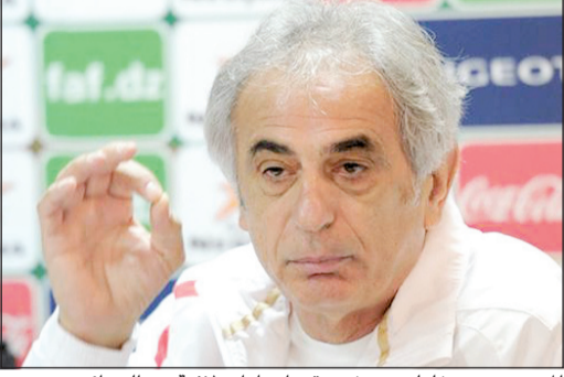
المدرّب وحيد خليلودزيتش حقق إنجازات لافتة مع الجزائر

تستعد الحكومة الجزائرية لمنح المدير الفني للمنتخب الاول لكرة القدم، اليوسني وحيد خليلودزيتش، الجنسية الجزائرية تكريما له بعد نجاحه في قيادة «محرابي الصحراء» إلى نهائيات كأس العالم 2014 بالبرازيل. وكشفت صحيفة « وقت الجزائر» في عددها الصادر أمس، أن الوعد الذي قدمه رئيس الوزراء عبد الملك سلال إلى خليلودزيتش لدى زيارته إلى مركز إقامة المنتخب الجزائري عقب تأهله إلى المونديال بعد فوزه على بوركينا فاسو 0-1 الاسبوع الماضي، هو منحه الجنسية الجزائرية، تكريما له للمجهودات التي بذلها طيلة 29 شهرا تولى فيها الإشراف على المنتخب الجزائري، وكللت بالتأهل للمونديال للمرة الرابعة في تاريخ الكرة الجزائرية والثانية على التوالي إلى المونديال. وكان خليلودزيتش كشف للصحافيين حينها أن رئيس الوزراء وعده «بشيء مهم» لكنه لم يكشف عنه فيما رد عليه عبد الملك سلال بالقول « اتركه سرا بيننا».