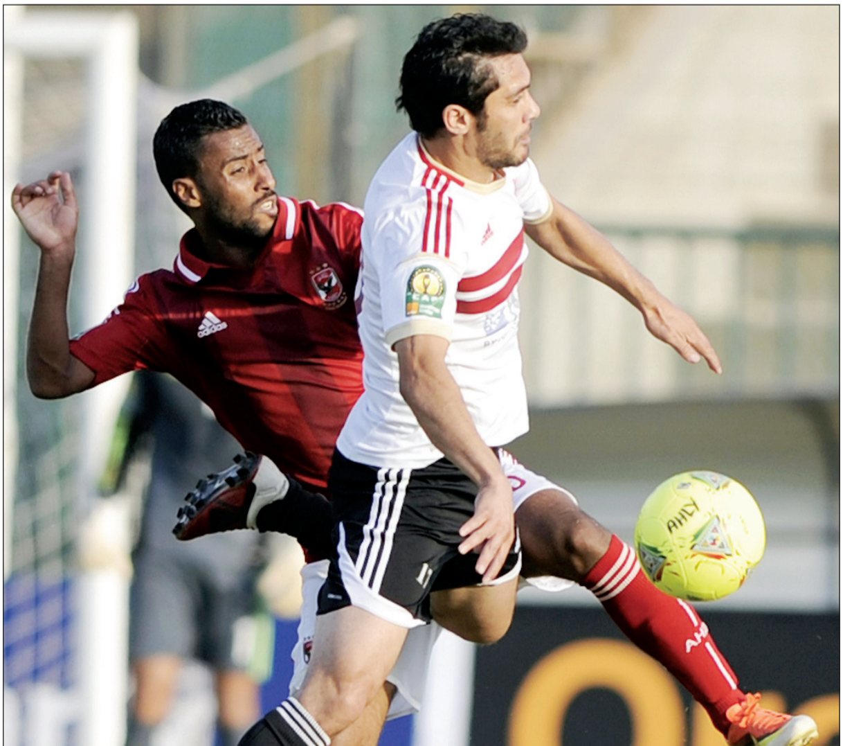
عشاق الكرة المصرية افتقدوا لقاءات الأهلي والزمالك المحلية