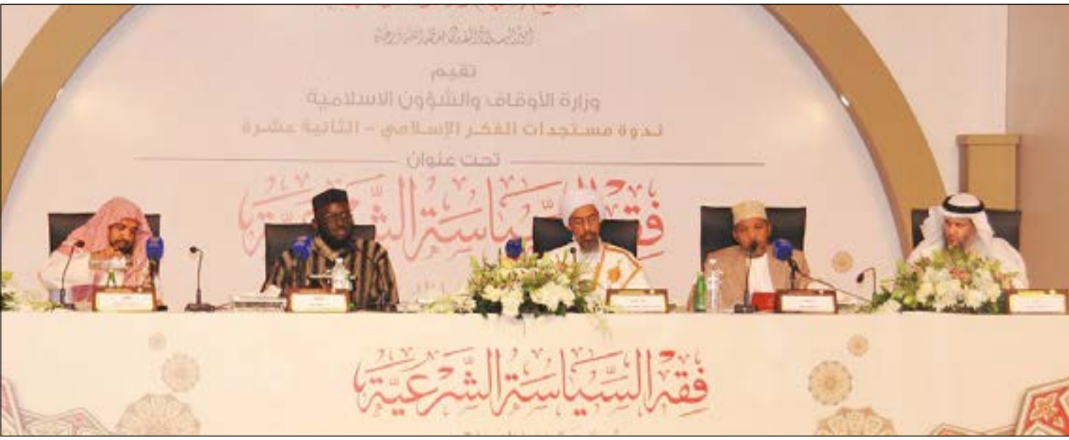
أحدى جلسات المؤتمر