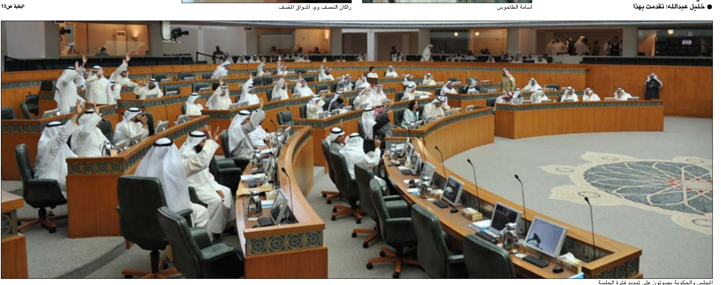
المجلس والحكومة يصوتون على تمديد فترة الجلسة