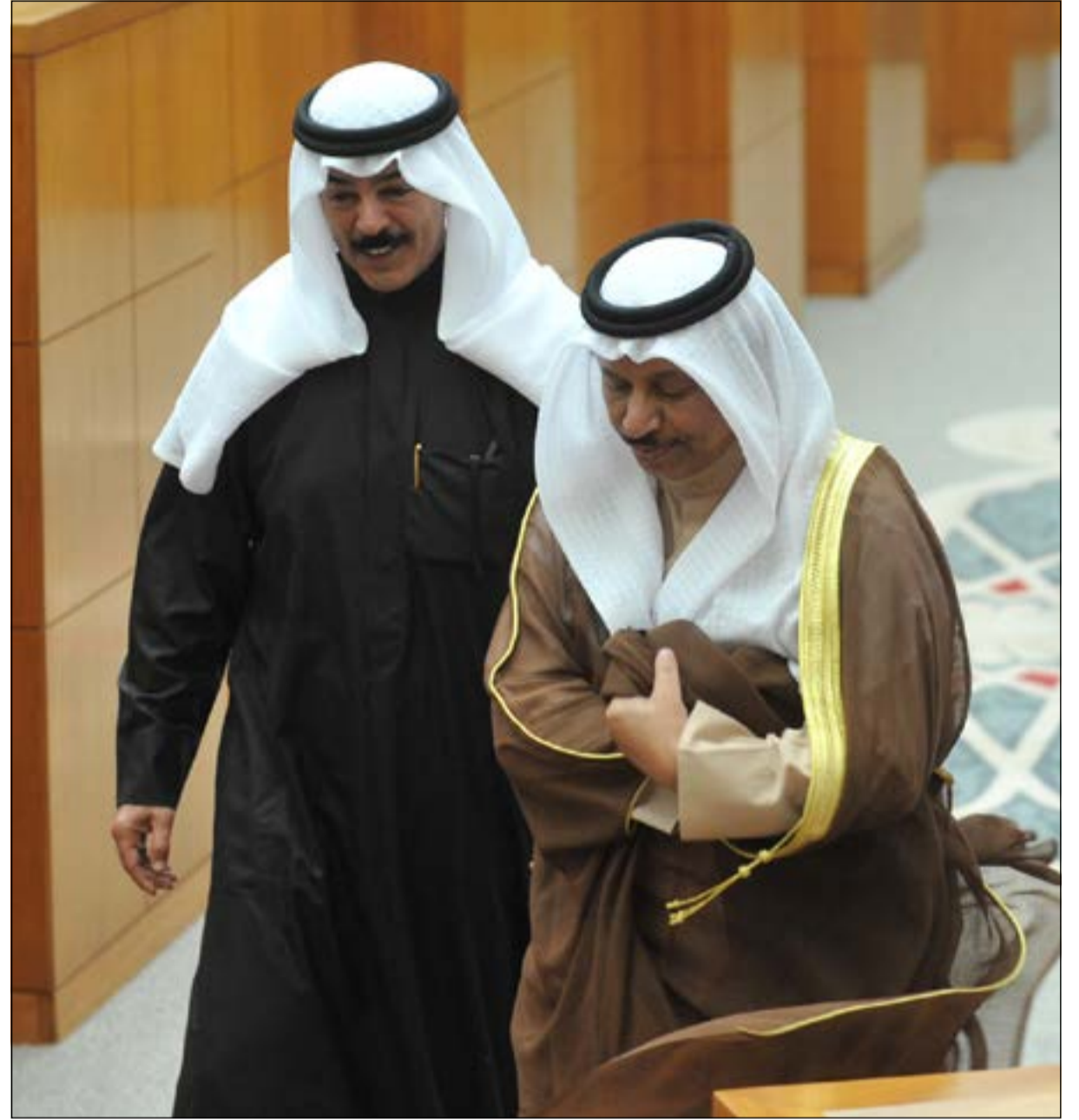
سمو رئيس مجلس الوزراء الشيخ جابر المبارك والشيخ محمد الخالد