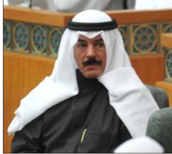
الشيخ محمد الخالد