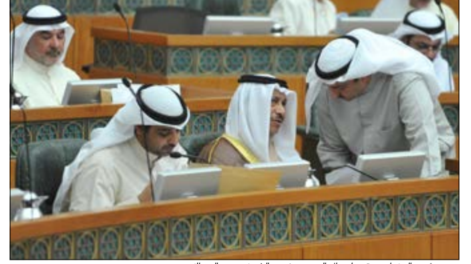
سمو رئيس الوزراء يستمع لجمال العمر بحضور الشيخ محمد العبدالله