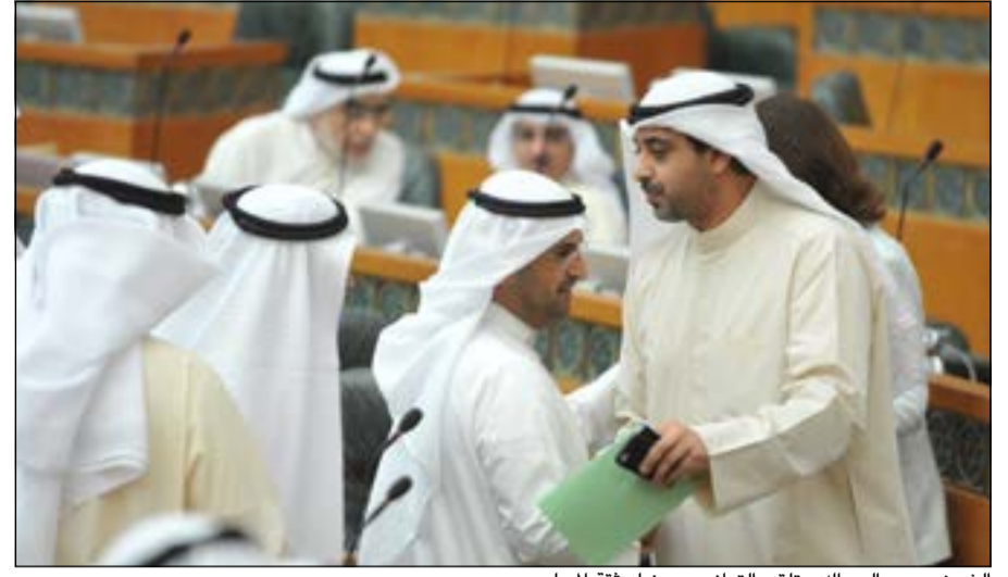
الشيخ محمد العبدالله يتلقى التهاني بعد نيله ثقة المجلس

المفروض ان نقر قانون الكويتية والالكترونية ولكن لن نقر بسبب الاستجوابات. ونحن لدينا اهتمام بالأولويات ومنها القضية الاسكانية التي حدد لها جلسة خاصة لمعالجة الملف الاسكاني.