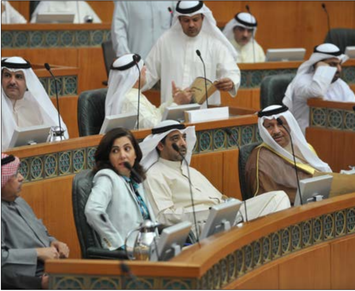
سمو رئيس الوزراء والشيخ محمد العبدالله ودرولا دشتي خلال الجلسة