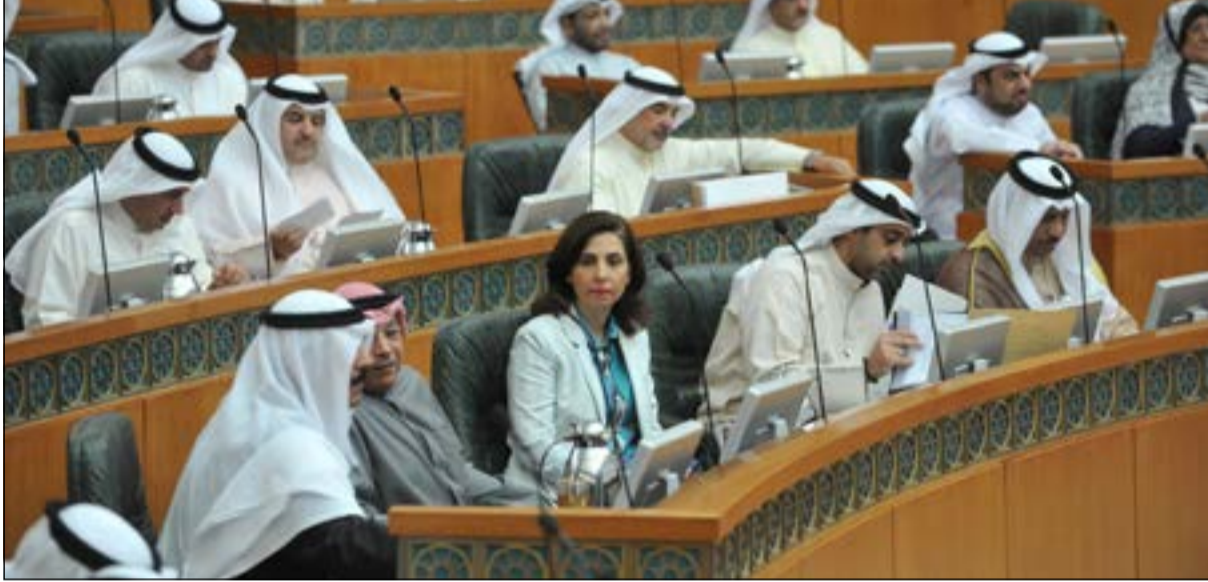
جانب من جلسة أمس