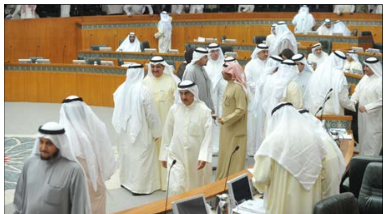
النواب والوزراء خلال رفع الجلسة للاسترخاء