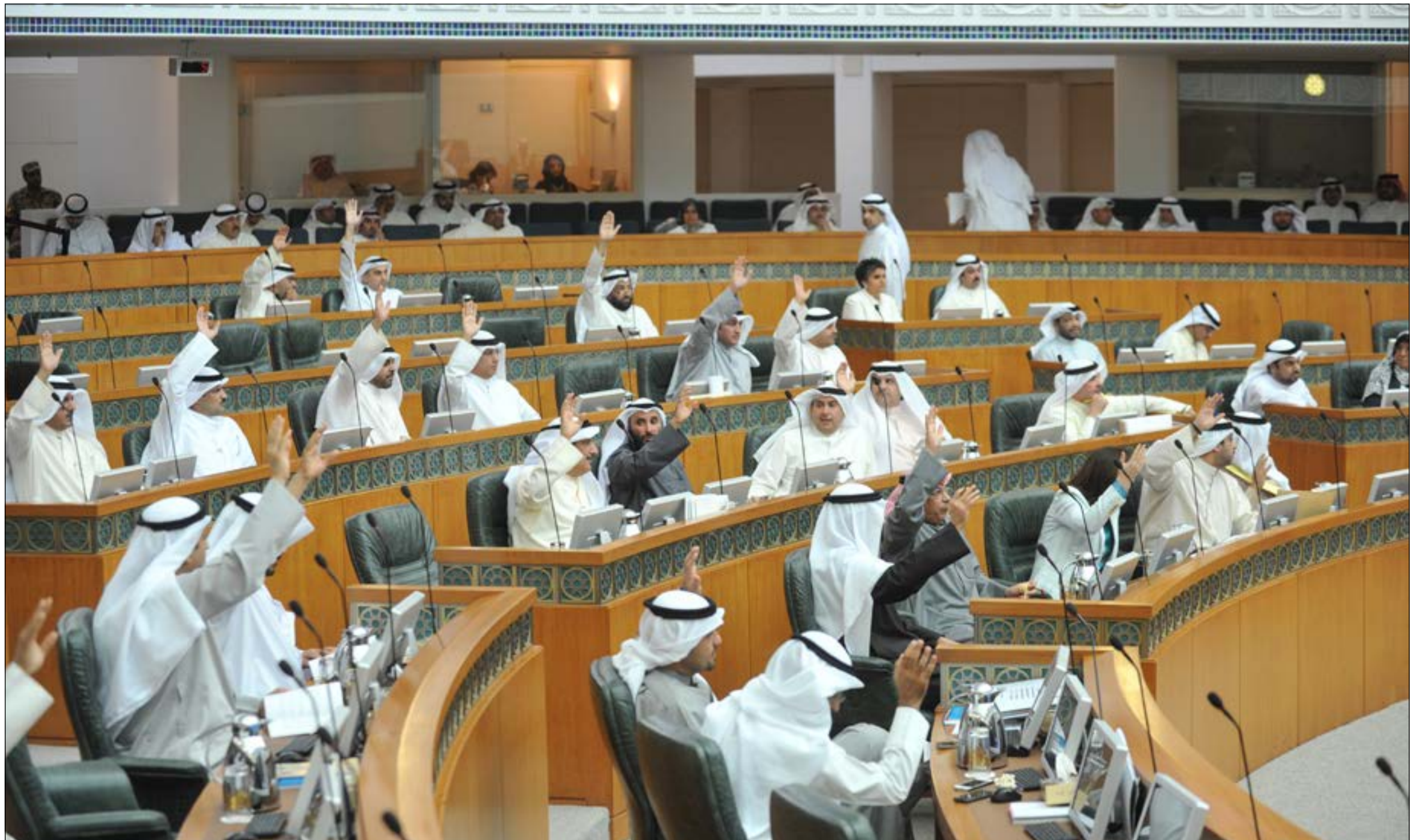
المجلس يصوت على أحد الاقتراحات