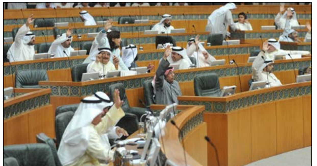
جانب آخر من الجلسة