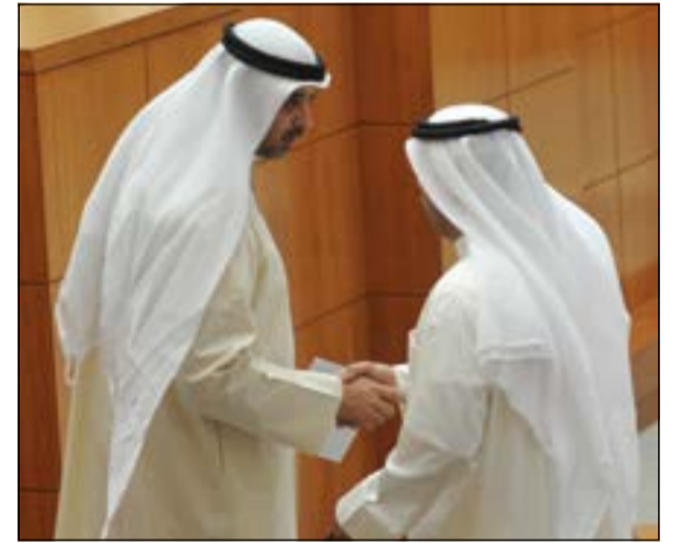
الشيخ محمد العبدالله خلال الجلسة