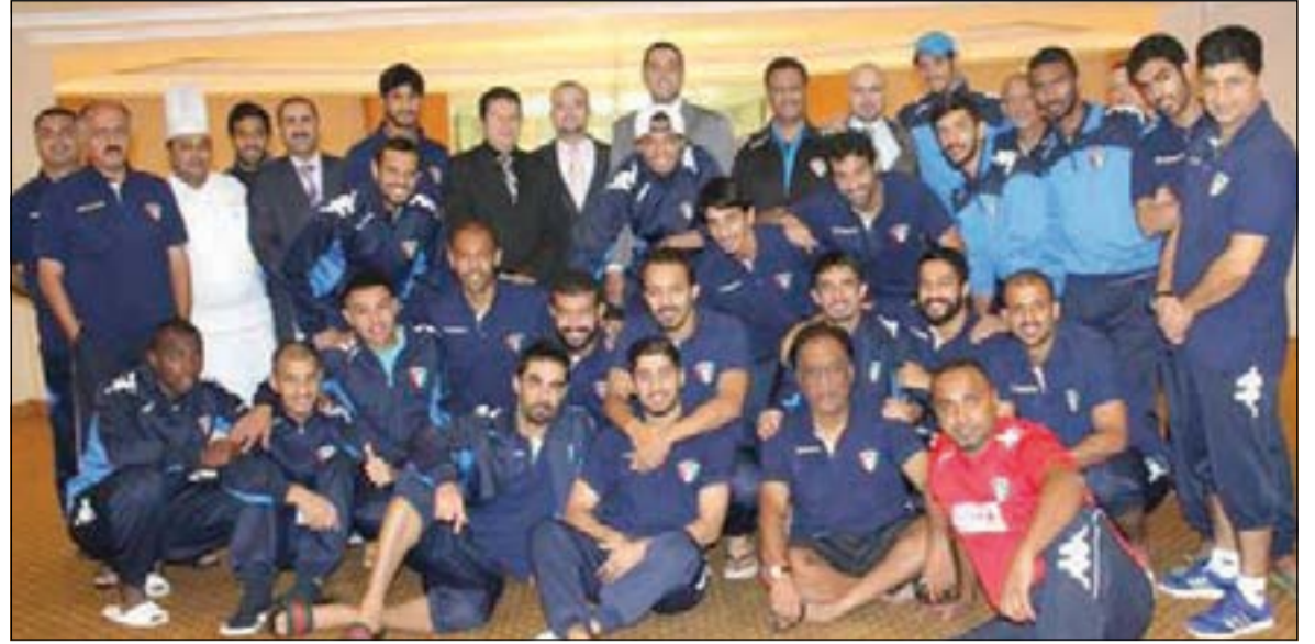
لقطة للاعبين المنتخب الوطني مع إدارة فندق ومنتجع سليل

وإمامي للفندق على حسن الضيافة. ويمناسبة التاهل يتقدم فندق كويثورن سليل الجهراء الوطني ولجمهير الأزرق بأحر التهاني والتبريكات وعلى رأسهم الشيخ دطال الفهد وفريق عمله متمنين لهم التوفيق في أسيا 2015 لتشریف الكويت وشعبها الكريم.