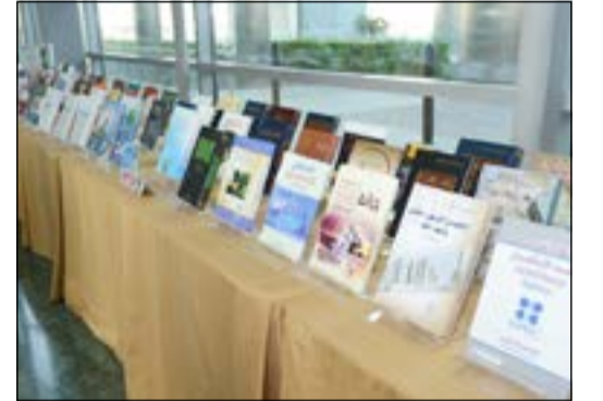
جانبا من المعرض

اعتبر وكيل ديوان المحاسبة إسماعيل الغانم معرض الكتاب السابع الذي يقيمه الديوان سنويا إنجازا مهما يتم من خلاله توفير آخر الإصدارات في مختلف مجالات العمل لموظفي الديوان. جاء ذلك خلال افتتاحه للمعرض الذي ينظمه مركز المعلومات التابع لإدارة المنظمات الدولية خلال الفترة من 25 إلى 27 نوفمبر 2013، وذلك بالتزامن مع معرض الكويت الـ 38 للكتاب الذي ينظم من قبل المجلس الوطني للثقافة والفنون والآداب.