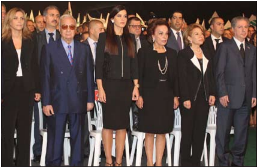
جانب من المشاركين باحتفال حزب الكتائب اللبنانية بذكرى تأسيسه محمود محمود الطويل

وقتل خلال هذه المعارك الدائرة منذ يوم الجمعة في