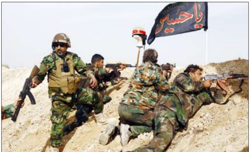
مقاتلون شيعية يتخذون مواقعهم إلى جانب قوات الرئيس بشار الأسد في السيدة زينب قبل يومين

سوى دليل واضح على حجم الكذب والتناق والتضليل في سياق متصل، اشار النائب قانصول الى ان كلمة