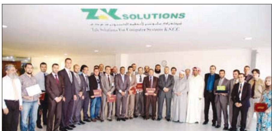
لقطة جماعية للفائزين في المسابقة الدينية لـ «زاك سلوشنز»

المسابقات وتنفيذها يأتي لروح العمل الطيبة التي تجمع بين الإدارة وموظفيها كافة.