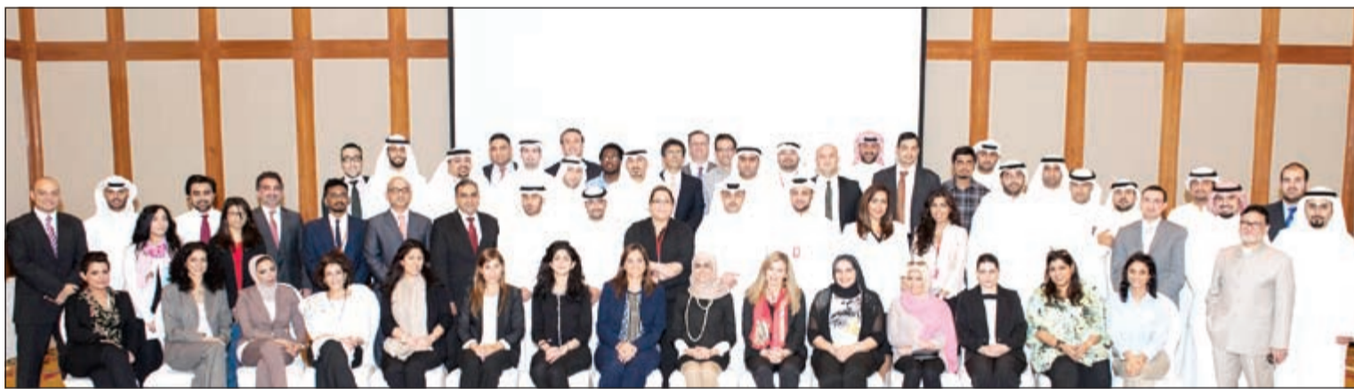
فريق بنك الخليج لتحدي الإدارة العالمي

حيث يقوم كل فريق بإدارة شركة افتراضية بهدف تحقيق أعلى سعر للسهم في سوق افتراضية للأوراق المالية. والفريق الفائز في المباريات الوطنية النهائية سيحصل على الجوائز النهائية، وسيتم تأهيل ممثلين أكثر من 40 دولة بما فيها الولايات المتحدة، وروسيا، والصين. وستجري هذه المسابقة في سوتشي في روسيا في شهر أبريل 2014.