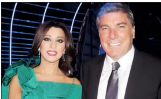
علي جابر ونجوى كرم

إعاقه إبراهيم قدام عرضا راقصا جميلا، أثنى عليه اللجنة وخصوصا لجهة التناغم في الحركات. بعدها كان هناك عرض قتالي مع فريق «كراتيه تويتز»، ولكن اللجنة رأت أنهم لم يقدموا أداء مميزا وأنه كان بإمكانهم تقديم الأفضل. بدوره قدم شاكر القنواي بخفة ظله عرضا شعبيا في جو من المزاح والفرح، فأثنت عليه اللجنة ولكنه كان مأخوذاً بنجوى فتغزل به طوال الفترة المتاحة له. أما طاهر جعفر فقدم عزا على البيانو فاثنت اللجنة على موهبته وشجعتة على تقديم الأفضل والتطور، وأخيرا قدم «جبروم مرات» عرضا لم