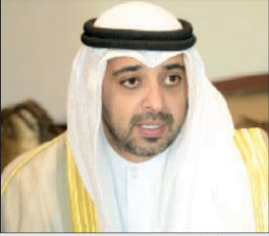
الشيخ محمد عبدالله

حتى الآن، وكان السبب في وقف علاجه تجني الإدارة السابقة للعلاج بالخارج بحرماته من حقه بالعلاج كمواطن! ما سبق هو بمنزلة مناقشة من محبي الفنان ولد الديرة لوزير الدولة لشؤون مجلس الوزراء ووزير الصحة الشيخ محمد عبدالله للنظر في حال هذا الفنان الذي أعطى لوطنه الكويت الكثير.. فهل من مجيب!