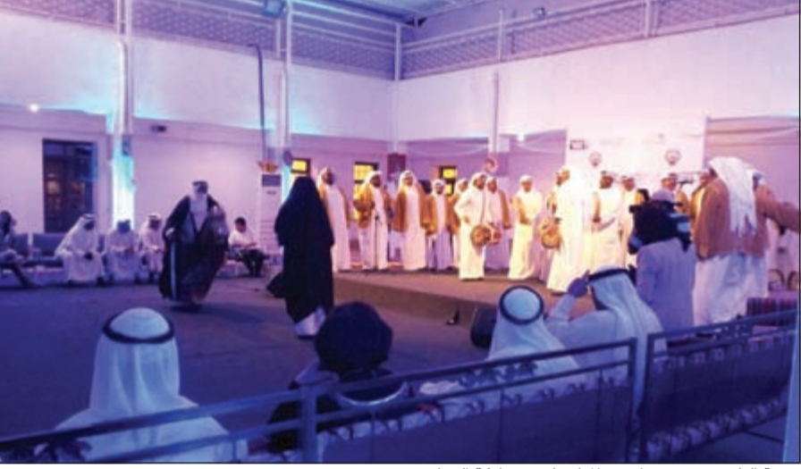
فرقة التلفزيون تحيي إحدى المناسبات بمشاركة الرعاة

مضاعفة نشاطاتنا والإرتقاء ببرامجنا، لتكون بمستوى الثقة التي نلناها من الجهات الراعية للمضي قدماً في تنفيذ سلسلة من الأنشطة التي تترجم أهدافنا المشتركة في خدمة التراث والمجتمع ودعم الشباب، ولا يسعني إلا أن أشكر شركة المركز المالي والبنك الوطني ووزارة الإعلام الذين جمعنا معهم أهداف خدمة المجتمع على دعمهم المتواصل ورعايتهم المتفيزة حتى نضع أيدينا بأيديهم لخدمة مجتمعنا وشبابنا وتراننا وحرقتنا الأصيلة.