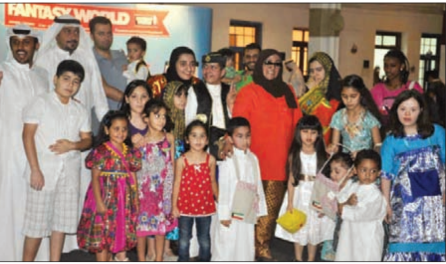
لقطة من أحد احتفالات بيت لوزان بمشاركة الأطفال