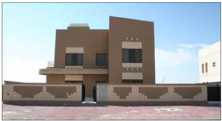
نموذج لإحدى الوحدات السكنية