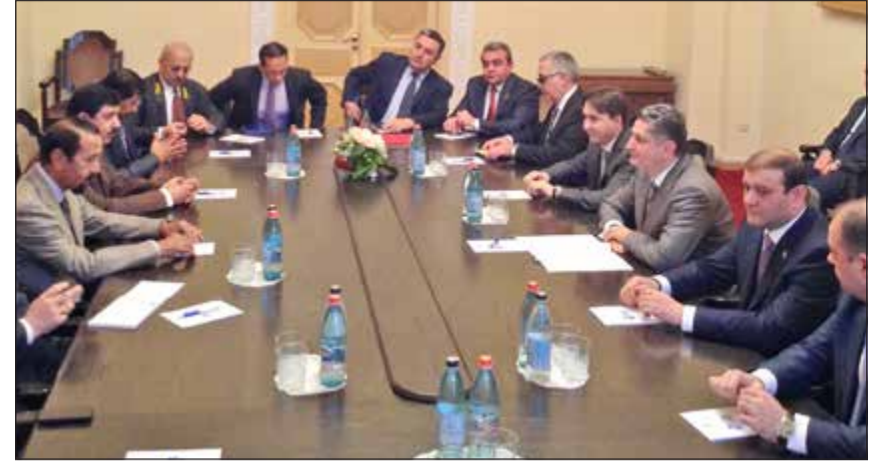
جانب من المباحثات بين الجانبين الكويتي والأرمني