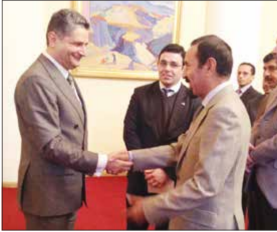
رئيس وزراء أرمينيا مستقبلا محافظ العاصمة الشيخ علي الجابر