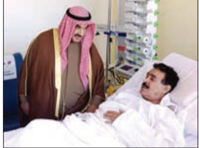
سمو الشيخ ناصر المحمد يطعن على صحة الجارالله

«الأنباء» تمنى له الشفاء العاجل ورود من القيادة السياسية للجار الله والأطباء يؤكدون: صحته مستقرة