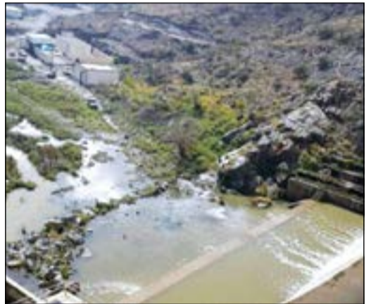
سد الجنابين في بلجرشي