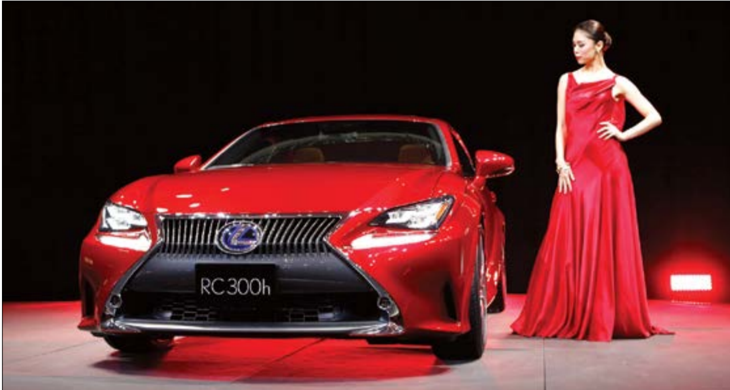
ليكزس RC300h، الهجينة، تتألق في معرض طوكيو