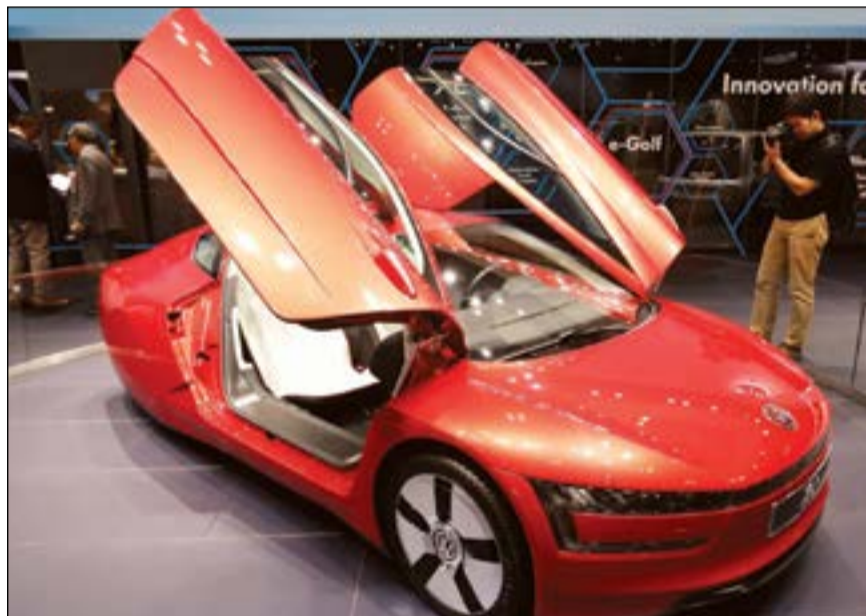
سيارة فولكس واجن XL1 تلفت الانتظار بمعرض طوكيو