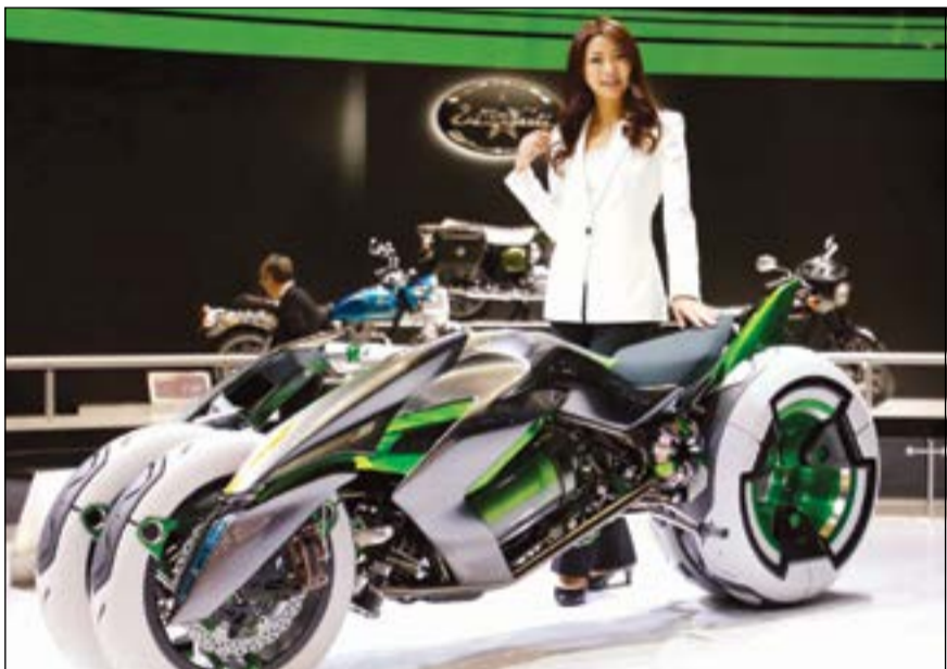
دراجة كاولسكي تأتي كمفهوم جديد للدراجات الكهربائية المسماة «إل»، حيث تم عرضها في معرض طوكيو للسيارات. ويمكن تحويلها من دراجة تقليدية بعجلتين تركز على السرعة إلى مركبة ذات ثلاث عجلات للاستمتاع برحلة جميلة

افتتح معرض طوكيو للسيارات في اليابان أول من أمس، والذي يوفر وسيلة للمصنعين اليابانيين كي يقوموا بعرض تقنياتهم البيئية، حيث المنافسة بين الخيارين الكهربائي والهيدروجيني كوقود للمستقبل، وقد قامت كبرى الشركات المصنعة للسيارات في العالم بعرض أحدث سياراتها في المعرض.