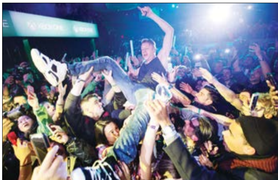
Macklemore يعني خلال إطلاق أجهزة إكس بوكس في نيويورك

يبدو أن «سوني» تريد أن تقفز بالتطور التقني خطوات واسعة إلى الأمام، فمع تسارع وتيرة تحرك الشركات نحو تطوير أجهزة يمكن ارتداؤها مثل النظارات الذكية، الساعات، تنتقل الشركة اليابانية نحو خطوة أكثر جرأة لأجهزة تكون جزءاً من جسم الإنسان. فقد تقدمت الشركة اليابانية بطلب براءة اختراع لـ «شعر مستعار ذكي» لمكتب براءات الاختراع والعلامات التجارية الأميركي، وهو يمثل نقلة جديدة في تطور تقنية الاتصالات. الجهاز الإلكتروني الذي يمكن تثبيته على