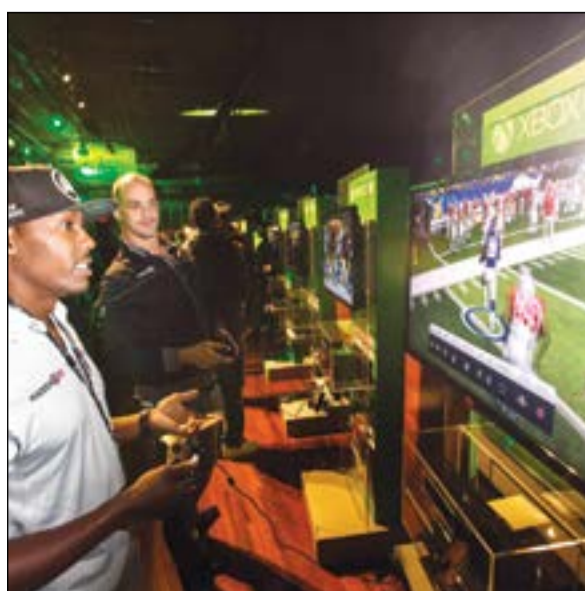
تجربة للعبة إكس بوكس خلال الإطلاق

رويترز: طرحت شركة «مايكروسوفت» منصة الألعاب «إكس بوكس ون» للبيع في اليوم مقابل 499 دولاراً. وفي الوقت نفسه، شهدت شركة التجزئة «بست باي» طلباً قوياً على منصة الألعاب المنافسة «بلاي ستيشن 4» في مدينة نيويورك، وذلك وفقاً للرئيس التنفيذي هوبير جولي أمس. وأعلنت «سوني» من قبل بيعها للمليون وحدة من «بلاي ستيشن 4» البالغ سعرها 399 دولاراً في اليوم الأول من طرح منصة الألعاب في الولايات المتحدة وكندا، وأوضح جولي في حديث له قائلاً: «سنحصل على مخزون جديد الأسبوع القادم»، وأضاف: «إنها بداية جيدة، لا يوجد شك في ذلك».