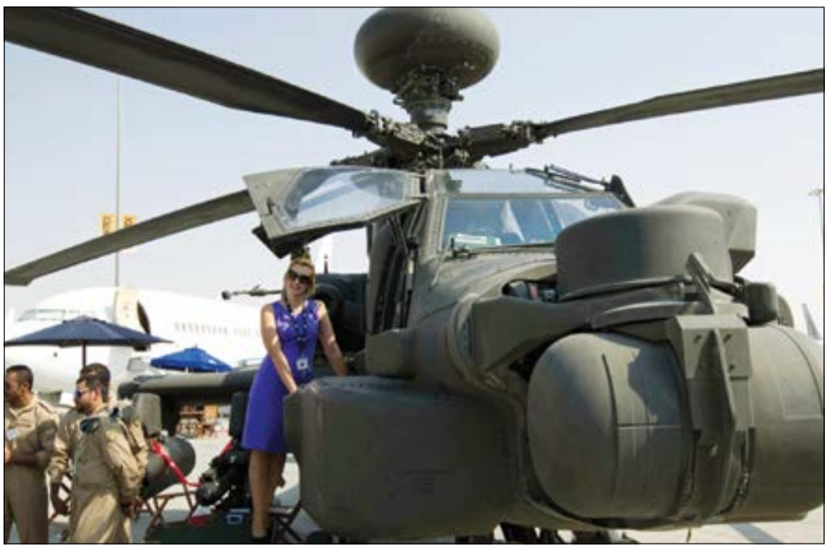
صفقات غير ناعمة أيضا في معرض دبي للطيران.. زائرة تلتقط صورة أمام طائرة هليكوبتر عسكرية خلال المعرض

وتقول مصادر في الصناعة إن بوينغ مازالت تجري محادثات مع شركة كاثي باسيفيك ومقرها هونغ كونغ التي قد تقرر طلب نحو 20 طائرة 777 - إكس التي ستصم لاستيعاب 400 راكب. وفازت إيرباص بطليبات جديدة للطائرة ايه - 350 - 1000 التي تستوعب 350 راكبا وتنافس 777 - إكس ومن المنتظر إنتاجها عام 2017 أي قبل ثلاث سنوات من الموعد المتوقع لطائرة بوينغ.