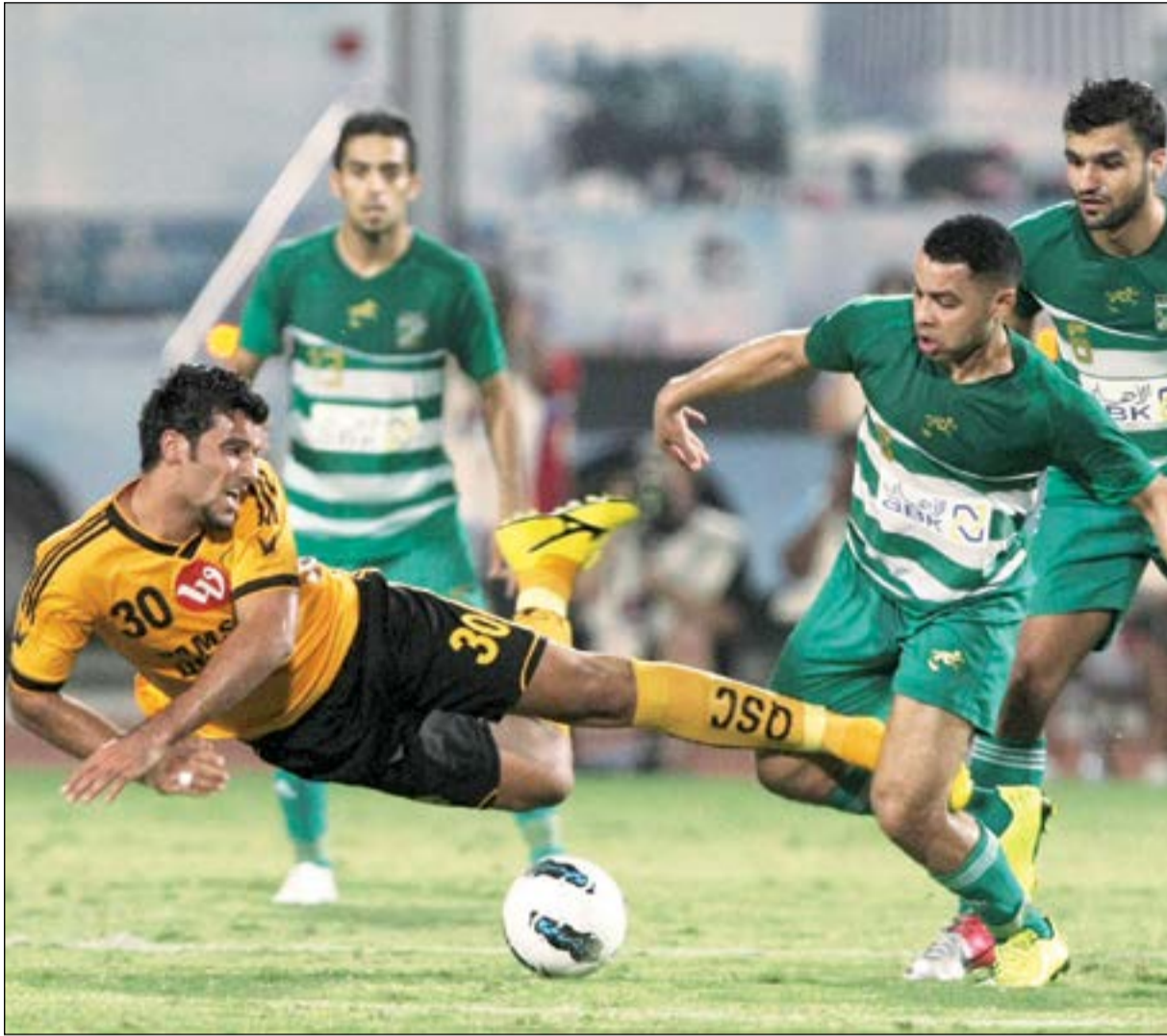
العربي والقادسية صراع متجدد في كل موسم