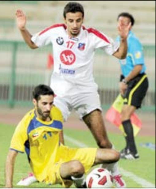
الأبيض يريد عبور الساحل لمواصلة الانتصارات