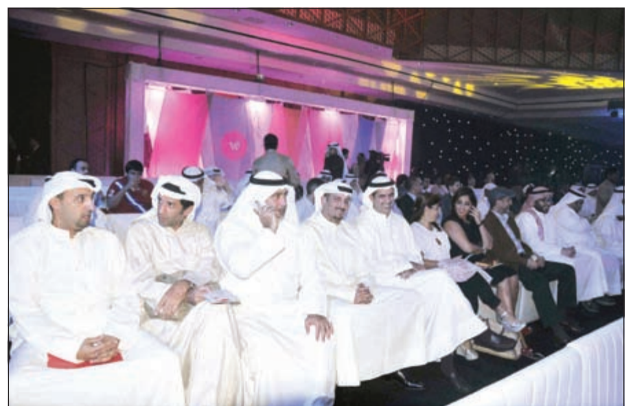
مناظرة كبيرة لأحداث ملتقى «الوطنية»

أهم لقطات الملتقى ● الاستضافة الأولى لشركة غوغل في الكويت. ● تخلت الندوة مقاطع فيديو لأهم إنجازات «غوغل» التكنولوجية في مجال الاتصالات والبحث بالإضافة إلى الأفكار الإبداعية الجديدة التي هي بطور التنفيذ والتي تعرض لأول مرة في الكويت. ● حضور موسيقى الجاز والراب أضفى جمالية على الملتقى فكان هناك مزيج بين الابتكار التكنولوجي والفني. ● اختارت «الوطنية» ان يكون ملتقى الابتكار مميزاً بدعوتها لقصي خضر المذيع السعودي ومقدم البرنامج ومغني الراب ليقدّم فقرات الملتقى ويضفي جواً من المرح والنشاط في زيارته الأولى للكويت. ● حضر الملتقى الفنان الكويتي مشعل ليلي من فرقة ميامي. ● حضور رئيس دولة أفريقية من الدول المشاركة في القمة العربية الأفريقية للملتقى.