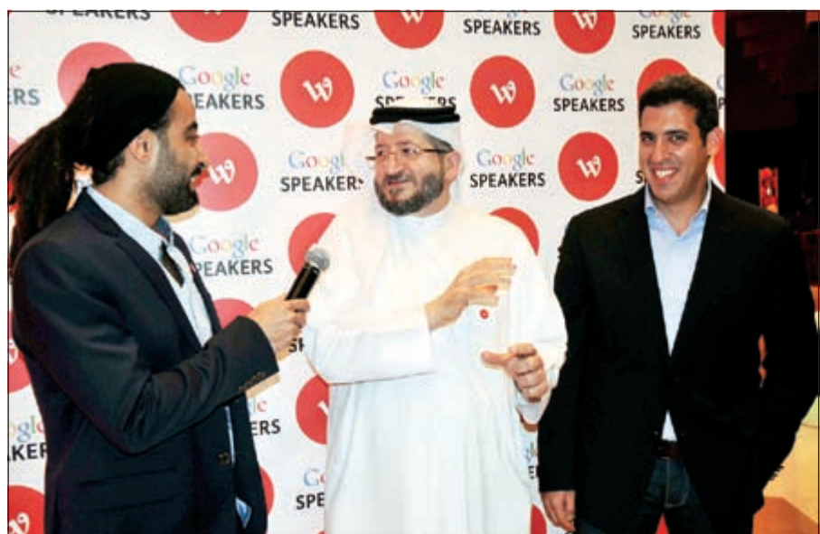
الإعلامي قصي خضر خلال فقرة مع عبدالعزیز فخر و بالملتقى

أهم لقطات الملتقى ● الاستضافة الأولى لشركة غوغل في الكويت. ● تخلت الندوة مقاطع فيديو لأهم إنجازات «غوغل» التكنولوجية في مجال الاتصالات والبحث بالإضافة إلى الأفكار الإبداعية الجديدة التي هي بطور التنفيذ والتي تعرض لأول مرة في الكويت. ● حضور موسيقى الجاز والراب أضفى جمالية على الملتقى فكان هناك مزيج بين الابتكار التكنولوجي والفني. ● اختارت «الوطنية» ان يكون ملتقى الابتكار مميزاً بدعوتها لقصي خضر المذيع السعودي ومقدم البرنامج ومغني الراب ليقدّم فقرات الملتقى ويضفي جواً من المرح والنشاط في زيارته الأولى للكويت. ● حضر الملتقى الفنان الكويتي مشعل ليلي من فرقة ميامي. ● حضور رئيس دولة أفريقية من الدول المشاركة في القمة العربية الأفريقية للملتقى.