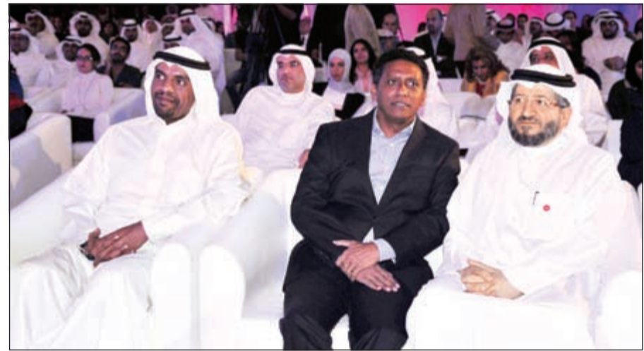
فخر مع كبار ضيوف الملتقى