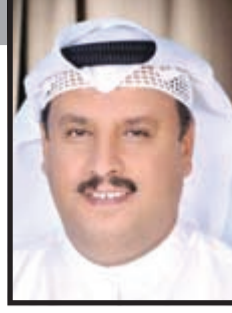
www.leeesh.com م. غنيم الزبعي