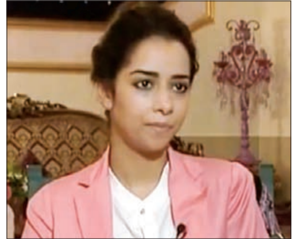
بلقيس بدون مكياج

وانتشرت الصورة على الـ «فيسبوك» وانقسمت تعليقات الجمهور بين من رأى أنها طليعية لبعدها عن التكلف الطبيعية لبعدها عن المكياج في أطلالتها، والبعض الآخر رأى أن المكياج نعمة كبيرة بالنسبة لها ولغيرها من الفنانين.