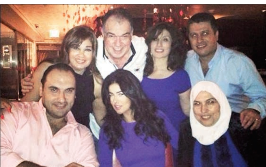
صورة من حفل خطوبة ابنة فيفي عبده

لندن بعد خضوعها للعلاج من وعكة صحية ألمت بها، وقالت إنها متواجدة في مصر منذ فترة ولم تسافر إلى أي بلد ولا تعرف من السبب في إطلاق مثل هذه الشائعات السخيفة