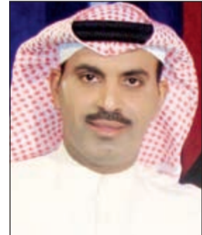
النجم طارق العلي في البرنامج

حيث حرصت مجموعة من القنوات التلفزيونية الخاصة منها «سكوب» و«الأصايل» و«الصباح» و«نجوم» وغيرها على شراء حقوق عرض جزئه الثالث الذي يحمل العديد من المفاجآت. يستضيف البرنامج، الذي تنتجه شركة انبندنس للإنتاج والنشر والتوزيع والدعاية والإعلان ويعرض مع مطلع الشهر المقبل، نخبة من نجوم الفن والإعلام والرياضة