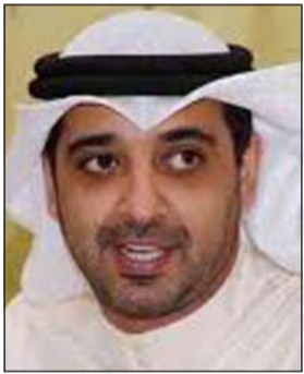
الشيخ محمد العبدالله

تقدم وزير الدولة لشؤون مجلس الوزراء ووزير الصحة الشيخ محمد العبدالله بالشكر الجزيل والعرفان لجميع منتسبي الإدارة العامة للإطفاء من ضباط وضباط صف على جهودهم المبذولة في التعامل مع مختلف الحوادث التي مرت بها البلاد خلال الأيام الماضية، مجسدين بذلك روح التعاون البناء في الحفاظ على أرواح المواطنين ومقدرات الوطن، وذلك ليس بغريب على رجال عاهدوا الله بتقديم الغالي من أجل هذا الوطن المعطاء.