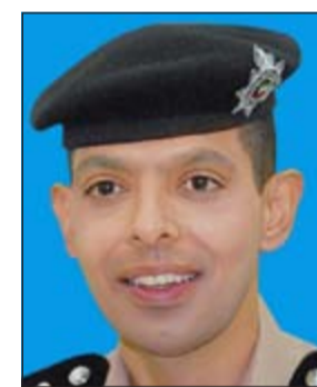
العقيد عادل الحشاش

أعلن مدير إدارة العلاقات العامة والتوجيه المعنوي ومدير إدارة الإعلام الأمني بالإنابة العقيد عادل الحشاش ان وزارة الداخلية وأجهزتها تلقت 3052 بلاغا خلال ايام الأحد والإثنين والثلاثاء الماضية تركزت في معظمها على تقديم الخدمات الإنسانية وتيسير حركة السير وإصلاح الإشارات الضوئية نتيجة هطول الأمطار السى جانب طلبات الإغاثة والنجدة ومساعدة الحالات المرضية وغيرها من البلاغات المعتادة عن الجرائم والحوادث والمخالفات. وأشار العقيد الحشاش الى الجهود التي بذلتها الإدارة العامة للعمليات المركزية من خلال بدالة الأمان (112) التي