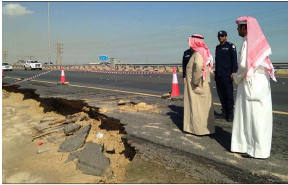
الشيخ د.إبراهيم دعيح متفقداً أحد الشوارع التي انهار جزء منها جراء الأمطار

قام وزير الكهرباء والماء ووزير الأشغال العامة م.عبدالعزیز الإبراهيم بجولة تفقدية في منطقة أم الهيمان وذلك للوقوف على حقيقة مشكلة تجمع المياه التي أدت الى اغلاق عدد من الطرق وغرق بعض المنازل بعد الأمطار التي شهدتها البلاد يوم الإثنين