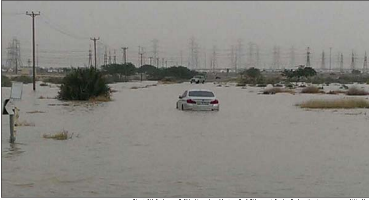
أمطار الإثني تسببت بخسائر مادية خاصة في منطقة أم الهيمان لقربها من المنطقة الصحراوية المكشوفة