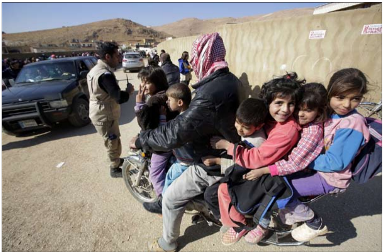
سوريون فارون من معارك القلمون ينتظرون تسجيل أسمائهم لدى مفوضية الأمم المتحدة للاجئين في البقاع اللبناني

وأكد الجيش بعد سيطرته على قسرة، تصميمه على مواصلة «ملاحقة الإرهابيين» الذين فروا من البلدة ولجأوا إلى الجبال والبلدات المجاورة. من جهتها قالت شبكة شام الاخبارية، إن الجيش الحر والكتائب الإسلامية بدأ بما وصفته «معركة جديدة في منطقة جبال القلمون بريف دمشق حيث تم استهداف مبنى الأمن العسكري بمدينة النبك وحاجز الجلاب فيها بعمليتين استشهاديين تلتتهما اشتباكات عنيفة على طريق الاتوستراد الدولي (دمشق - حمص) أسفرت عن انقطاع الطريق مجدداً». وقالت إن الجيش الحر استهدف «تجمعات لقوات النظام على تل الرئيس حافظ في دير عطية بعدد من القذائف والصواريخ المحلية تزامناً ذلك مع قصف عنيف من قبل قوات النظام على مناطق الاشتباك وبساتين النبك ودير عطية مولود للنظام وبقيت بمنأى عن النزاع حتى الآن».