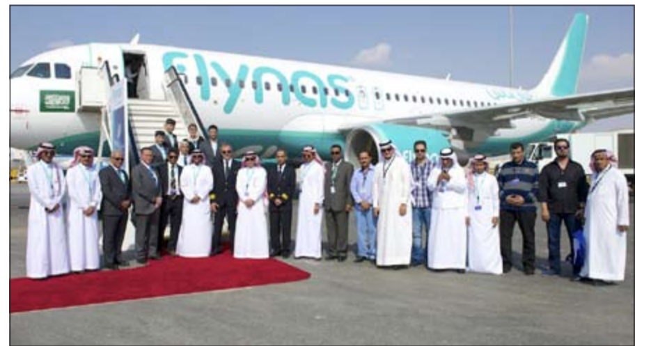
إطلاق الرحلات الجديدة لـ«طيران ناس» خلال معرض دبي

أعلنت شركة «طيران ناس» خلال مشاركتها في معرض دبي الدولي للطيران عن توسع جديد في شبكة خطوطها الجوية وتشغيل رحلات بعيدة المدى إلى كل من القارة الأوروبية وشمال أفريقيا وشبه القارة الهندية وذلك بإدراج وجهات حيوية تشمل لندن، باريس، الدار البيضاء، مومباي، ولاهور، ومن المتوقع تشغيل الوجهات الجديدة خلال الربع الثاني من العام 2014. وقال الرئيس التنفيذي لمجموعة ناس القابضة سليمان الحمدان: «يندر اهتمامنا وتوجهنا نحو القارة الأوروبية ضمن استراتيجيتنا الجديدة التي تهدف إلى نقل 20 مليون مسافراً سنوياً بحلول العام 2020، ونحن على ثقة عالية بأن إضافة خيار جديد إلى هذه الخطوط الجوية الحيوية سجدت صدى إيجابياً واسعاً، لاسيما أن