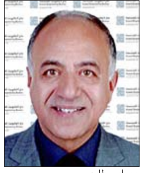
م سامي طابع

كشفت «سامسونغ للإلكترونيات» عن الجهاز اللوحي الجديد «غالكسي نوت 10,1» (إصدار 2014)، والذي يعكس نهجاً مبتكراً في الموازنة بين الإنتاجية وبراعة إنشاء المحتوى والاستهلاك. ويأتي الجهاز مزوداً بشاشة مذهلة بحجم 10 بوصة من نوع الشاشات البلورية السائلة (LCD) فائقة الوضوح (WXGA) بدقة تبلغ (1600 × 2650)، ومعالج ثماني النواة 1,9 غيغا هرتز (لنسخة الجيل الثالث/الواي فاي) وذاكرة وصول عشوائي (3 RAM) غيغا بايت، يجسد ريادة سامسونغ في الابتكار، حيث يوفر أقصى إمكانيات الإنتاجية مع المحافظة على خفة الوزن والنحافة، ويمكن المستخدمين من تشغيل حالات منفصلة من نفس التطبيق، واستخدام قلم S Pen محسن لسحب وإسقاط المحتوى من نافذة إلى أخرى، أما نافذة القلم (Pen Window) فتسمح للمستخدم برسم نافذة بأي حجم على الشاشة، والوصول فوراً إلى ميزات فريدة داخل التطبيق مثل «YouTube» أو الحاسبة.