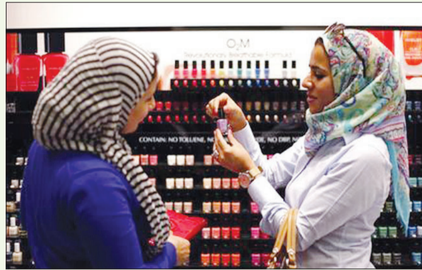
إقبال شرعي على مستحضرات التجميل