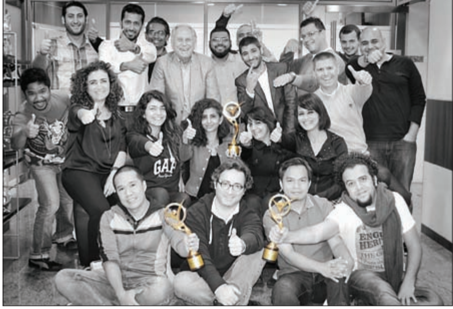
فريق عمل هورايزن

حصلت وكالة «هوريزون» درافت اف سي بي» للدعاية والإعلان 3 جوائز مرموقة في إطار فعاليات «جائزة الإبداع الإعلاني» للعام 2013، التي نظمت مؤخرًا برعاية وزير الإعلام ووزير الدولة لشؤون الشباب الشيخ سلمان الحمود.