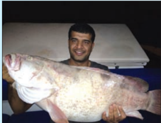
أوووووووه بدون تعليق

كم قضيت وأنت بالبحر وأين بدأت؟ ● قضيت في البحر أكثر من 20 عاماً وأنا اصطاد الأسماك