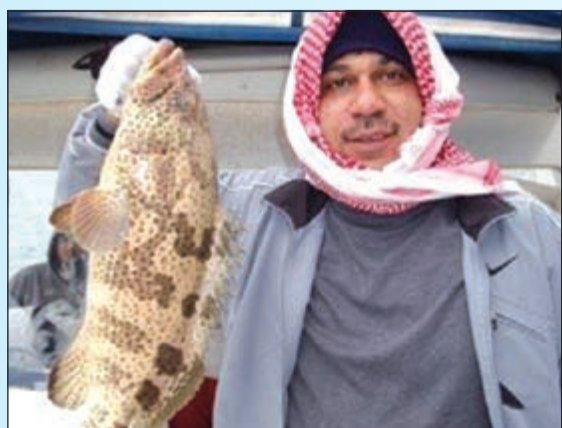
وعندك واحد بالول وصلحو