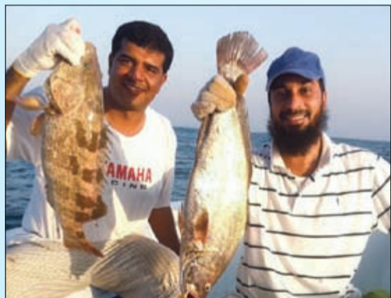
الحلى بالول وفرخ شماهي