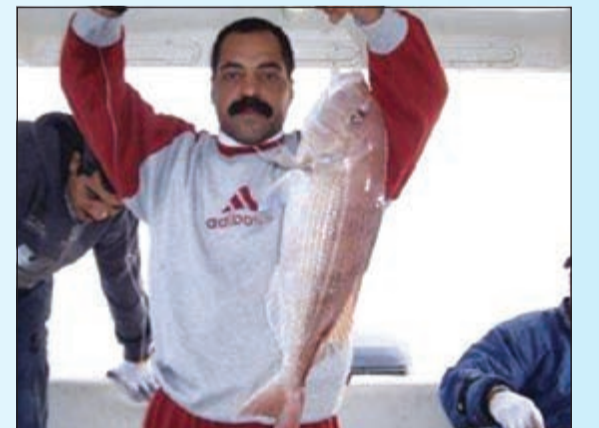
نهاش المحاقق الجنوبية