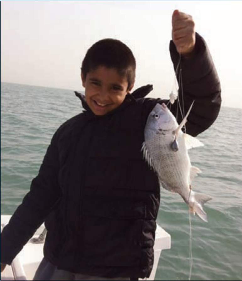
الحداق الصغير مع الشعم