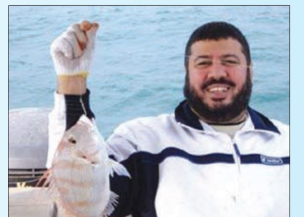
يا عيني على صيدك