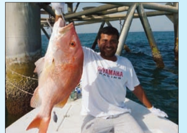
شوف الحمرا العملاقة