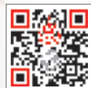
لتحميل التطبيق عبر المراسل