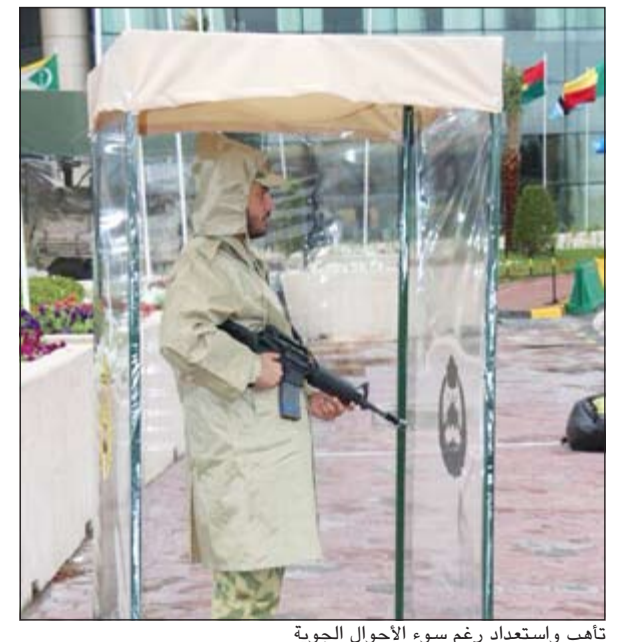
تأهب واستعداد رغم سوء الأحوال الجوية