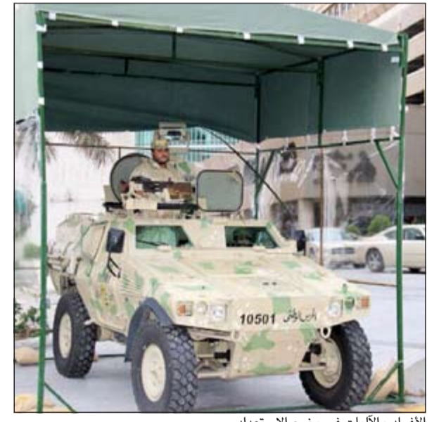
الأفراد والآليات في وضع الاستعداد