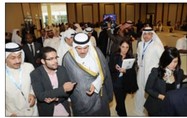
الشيخ سلمان الحمد خلال تفقده المركز الإعلامي للقمة

التنمية والاستثمار وتلك قيضة لا خلاف عليها تجمع التنمية في كافة المجالات وتحقق التقارب السياسي المأمول لنحقق التعاون الدولي المأمول». وأشار الشيخ سلمان الى ان الامور تسير «بشكل مميز ومشاركة من عدد كبير من قادة الدول كذلك العديد من المسؤولين في المنظمات الدولية وهذا المؤتمر له ابعاد كثير هو التواصل الثقافي الذي يعتبر اداة لتوطيد العلاقات بين الشعوب ويسعى لها الجميع» مشيراً الى انه تم اعداد مجموعة من الأنشطة المصاحبة لهذه هذا المؤتمر منذ شهر ومنها استضافة العديد من الفرق العربية والأفريقية لتقديم ترانها وثقافتها بالإضافة لاقامة معرض للحرف الأفريقية بمشاركة 56 متخصصاً وفناناً من الدول القريبة والعربية.